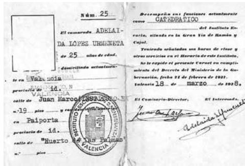
Fotografia 9. Certificat de treball de l'Institut-Escuela de València d'Adelaida López (APLBL)