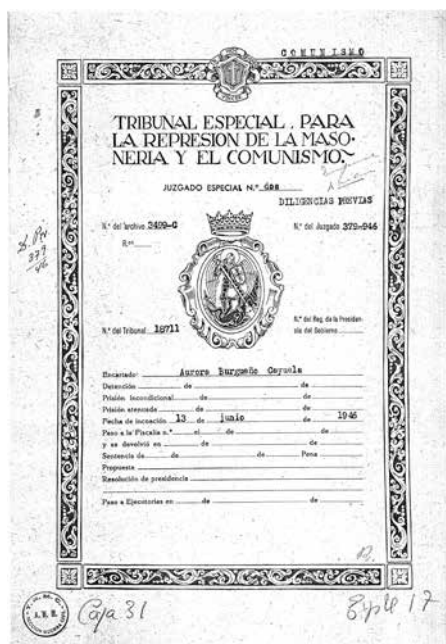
Fotografia 12. Sumari obert contra Josefa Aurora Burgueño pel TERMC