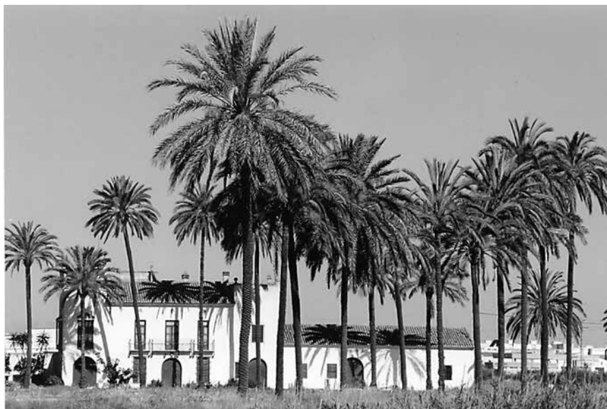
Fotografia 1. Hort de les Palmes en 1998, quan encara mantenia la seua esplendor