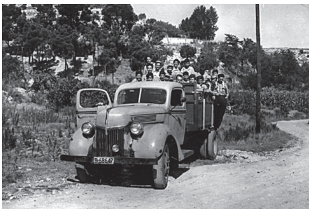
Fig. 5. Grup de nens de Wad Ras d'excursió en un camió a mitjan anys cinquanta.