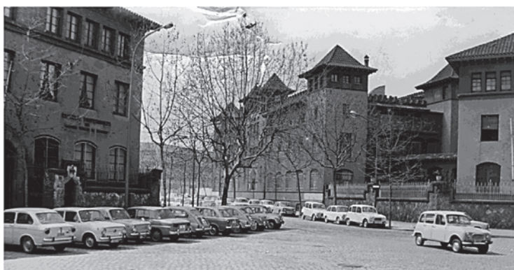
Fig. 7. Vista des de l'exterior de Wad Ras - Institut Ramon Albó, a finals dels anys seixanta.