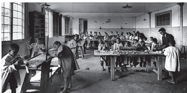
Fig. 1. Nens interns a Wad Ras en els tallers a inicis de la dècada de 1940.

Nosaltres, amb el nostre relat, hem intentat oferir sempre la visibilització d'aquells que ho van viure. Aquest article està dedicat a ells i a tots aquells i aquelles que no han parlat però que hi estan representats i a la seva memòria.