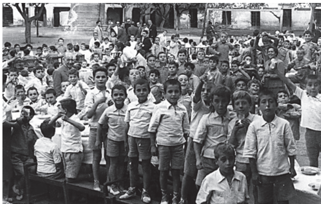
Fig. 3. Grup de nens al pati amb l'uniforme, any 1953.