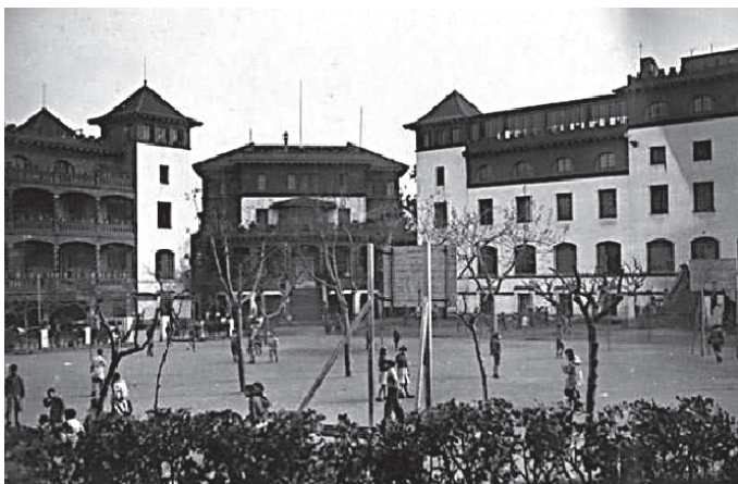
Fig. 4. Vista del pati de Wad Ras amb nens i nenes a mitjan anys trenta.