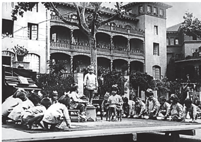
Fig. 2. Grup de nenes i nens en una actuació a inicis dels anys vint.