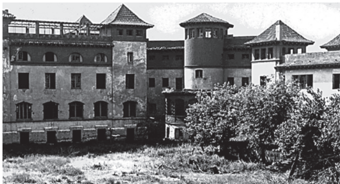
Fig. 8. Vista de l'interior de Wad Ras - Institut Ramon Albó, a inicis dels anys setanta, en estat d'abandonament i degradació.