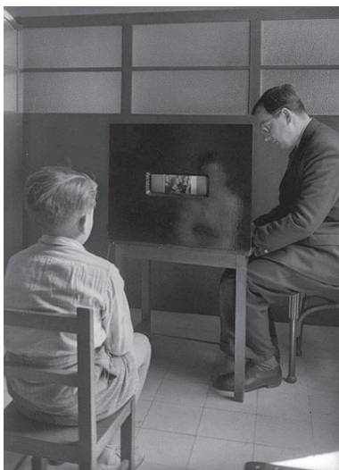
Fig. 6. Josep Joan Piquer i Jover al laboratori psicotècnic de Wad Ras a mitjan anys quaranta. Procedència: Fotografia del Fons ANC 1-42 / Branguli (fotògraf), Arxiu Nacional de Catalunya - ANC, referència: ANC 1-42-N-22104).