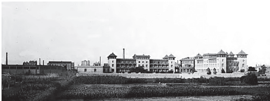
Fig. 1. Vista posterior de Wad Ras a inicis dels anys vint.

Arribem a la fi d'aquest trajecte, que no vol ser el viatge definitiu perquè les recerques històriques sempre són provisionals i poden ésser enriquides amb fonts noves o amb l'explotació diferent de les existents. De ben segur que encara podrem accedir a noves aportacions que ens apropin al que milers de nens i nenes van viure en la seva infància al Grup Benèfic, amb els seus noms i moments diferents.