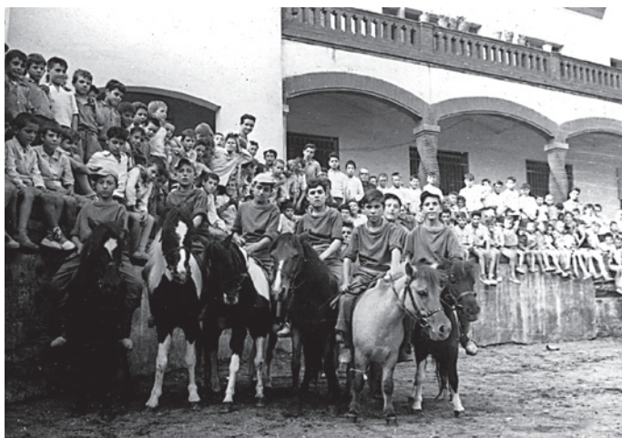
Fig. 7. Grup de nens fent jocs amb ponis al pati de Wad Ras als anys cinquanta.