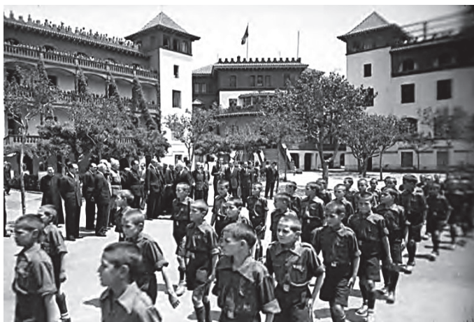
Fig. 5. Nens interns a Wad Ras, desfilarant davant de caps de la Falange a inicis de la dècada de 1940.