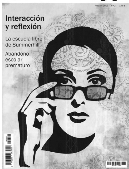
IMAGEN 2. Revista Cuadernos de Pedagogía, 427 (2012)