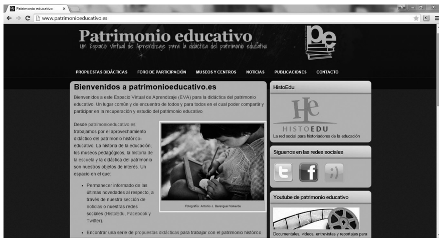
Imatge 1. Espai virtual d'aprenentatge per a la didàctica del patrimoni educatiu <patrimonioeducativo.es>.

de Mestre d'Educació Infantil i Mestre d'Educació Primària 39 de la Facultat de Magisteri de la Universitat de València. La transferència d'uns continguts historicoeducatius propis de l'ensenyament superior a la resta dels nivells del sistema educatiu, així com l'interès mostrat pels futurs mestres en introduir la comprensió de la gènesi i l'evolució de l'educació a la seua futura tasca docent a peu d'aula per fer partícips els seus alumnes del seu passat educatiu, aconsegueix trencar amb l'aïllament del món universitari i obtenir una vertadera transferència del coneixement historicoeducatiu al seu lloc d'origen: l'escola.