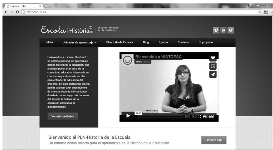
Imatge 3. Entorn personal d'aprenentatge Escola i Història 2.0.

Discursos pedagògics (l'Escola Moderna, les missions pedagògiques de l'ILE, etc.); Política i legislació escolar; Cultura material i pràctiques escolars (espais i condicions materials, propostes d'organització escolar, etc.); La professionalització del magisteri (escoles normals i formació del magisteri); i Modernització i innovacions educatives (moviments de Renovació Pedagògica, MRP). Així, com un exemple del que entenem com a Història de l'Educació 2.0 i Història de l'e-Educació, gràcies a aquestes unitats d'aprenentatge autònom, qualsevol interessat en la història de l'educació (sense tindre necessitat de ser alumne d'un grau de ciències de l'educació), en qualsevol moment i espai, pot treballar i aprofundir en aquests continguts historicoeducatius, rebre un feedback de la resta de la comunitat educativa i augmentar la difusió i els possibles destinataris d'una tasca docent que trenca amb els límits físics i temporals de l'aula universitària i arriba fins a qualsevol lloc amb connexió a Internet.