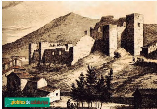
Litografia del Castell de l'Espluga de Francolí (s. XIX). Publicada per Pobles de Catalunya. Guia del Patrimoni Històric i Artístic dels Municipis Catalans. (Reproducció autoritzada).