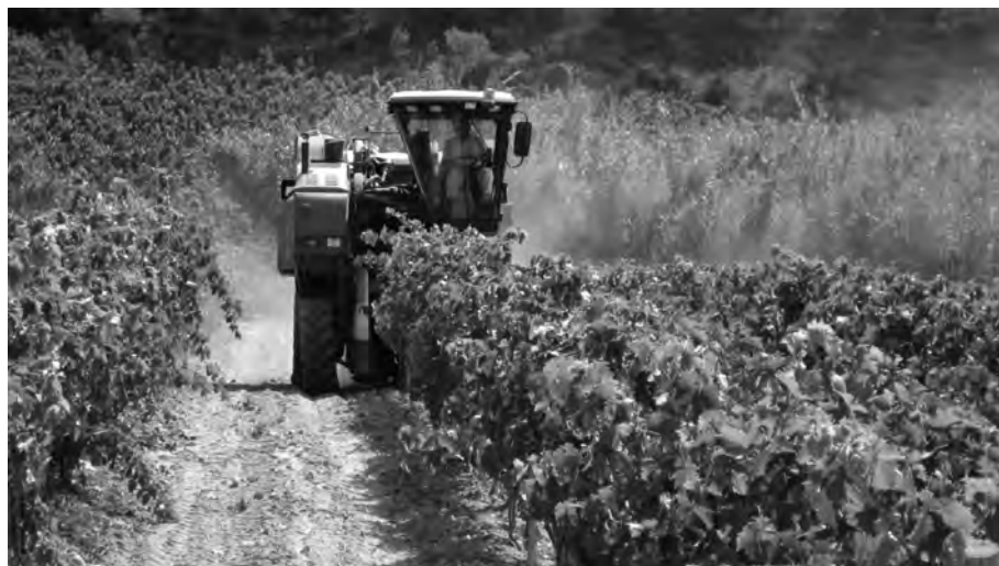
FIGURA 2. Verema en una vinya de parellada de la denominació d'origen Penedès (2009)

En aquesta època s'inicià una altra activitat que arribà a tenir molta importància. Es tracta de la producció de materials i equips de reg per aspersió. En aquest camp, destaquen empreses com Humet (Santa Perpètua de Mogoda), Riego Wright (Barcelona, 1960) i Ura-Riego, del grup Uralita. Una mica més tard, a la meitat dels anys setanta, aparegueren les primeres firmes