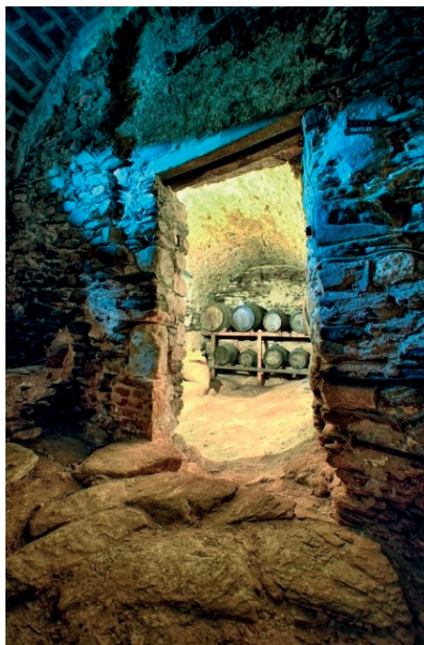
FIGURA 6. Quadres de la casa, algunes directament sobre la roca mare, i d'altres enllosades. Aquí el rellotge del temps s'ha parat. El desgast de la roca mare per trepig del bestiar es esfereïdor; tant pot ser que es tracti de deu segles com de vint.

Aquells masovers van marxar i la casa va entrar en decadència, però dos anys abans de morir el meu pare el vaig convèncer, com a mínim, de refer el teulat principal, ja que si jo heretava segurament ja me l'hagués trobat a terra, i considerava que la casa s'ho valia, tot i