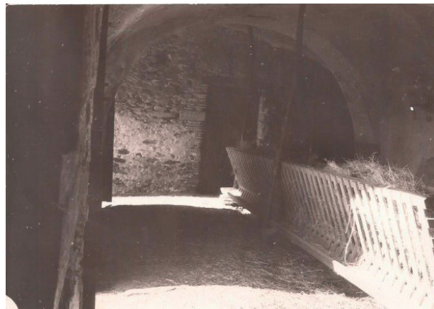
FIGURES 10 i 11. Tots els baixos amb rastells, les tres portes foranes de la casa obertes al pati clos. L'objectiu era produir calor animal a la casa, com l'havia tingut sempre. El pastor venia cada dia, treia les cabres i les tornava a tancar. Els cabrits pagaven el pastor, i la casa es mantenia. (Fotografies: Joan Botey, 1970.)

quadres a l'oest. També, dotar la casa de sanitaris, aigua corrent i electricitat fotovoltaica, a més de pintar i ressaltar els detalls que ha anat acumulant amb els segles.