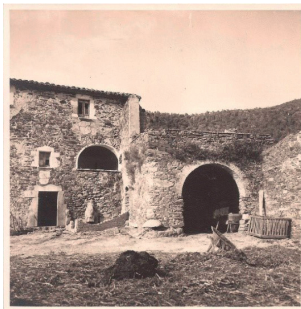
FIGURA 8. Just abans de les obres del 1966, el meu pare va fer aquesta fotografia, on el terrat ja no tenia teulat, i es pot observar una construcció de totxo adossada, que era una porquera els animals de la qual s'alimentaven amb deixalles des de l'eixida estant.

Al cap de deu anys, una casa tan autèntica fou pol d'atracció dels hippies . Es va mantenir el ramat, però ells passaren a habitar el pis de dalt; pouaven l'aigua