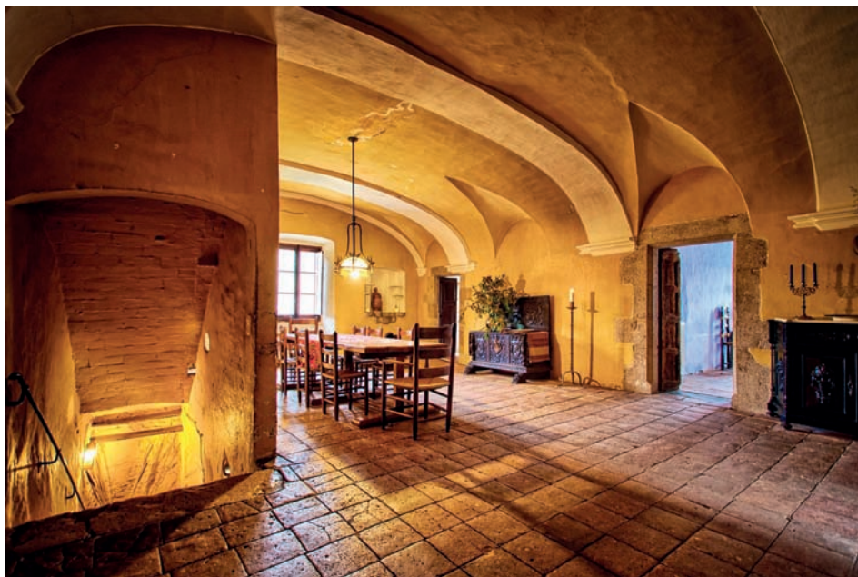
FIGURA 4. Les obres sump- tuàries degudes al comerç del suro per a taps portaren vers el 1800 a la construcció d'aquesta sala amb volta al primer pis, farcida de detalls com l'aiguamans, la fornícula per a la Verge, o la famosa lleixa de la núvia.

de característiques similars a les actuals. Una meravella de material i una solució inèdita.