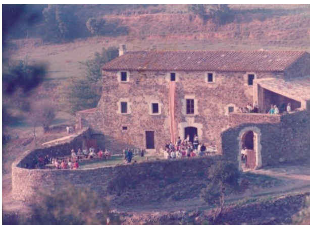
FIGURA 16. La inauguració el setembre de 1986 va ser una fita important per a nosaltres. Es tractava d'un pas de gegant fet amb molt pocs mitjans, per a intentar no perdre aquest tipus de patrimoni tan substancial per als catalans i tan important per al territori, però calia tornar-li a donar vida pròpia.

El canvi de model té un rerefons social al meu entendre molt enriquidor. A tot arreu, quan es vol conservar quelcom es transforma en un museu. Un museu és una figura morta, i, al meu entendre, una masia museïtzada només mostra una part de la seva riquesa; una masia en un lloc fa i ha fet una funció social i cultural immensa: ha vertebrat un territori. Si ara, com a productor de matèries primeres ja no es guanya la vida, l'hem de reinventar, però si el que augmenta és la freqüentació, cal explotar la seva vessant d'acollida, d'aixopluc, de senzillesa i de solidaritat en el territori. Hi dona vida i cultura.