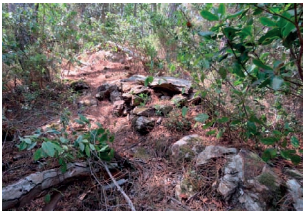
FIGURA 2. Les vedrunes, o parets de terme, estan absolutament enterrades de vegetació dins del bosc, però hi ha llocs on són encara molt importants. De fet, la primera delimitació de terrenys es feu en època romana i aquests en són els testimonis d'aleshores.

Els dòlmens no només varen ser importants com a monuments en l'època neolítica, sinó que també en l'època romana, els que es coneixien aleshores, serviren de referència per a delimitar finques («vil·les»). I això és el que passa en el Mas Cals; vuit dòlmens serveixen avui de termes a la finca —crec que és un cas únic.