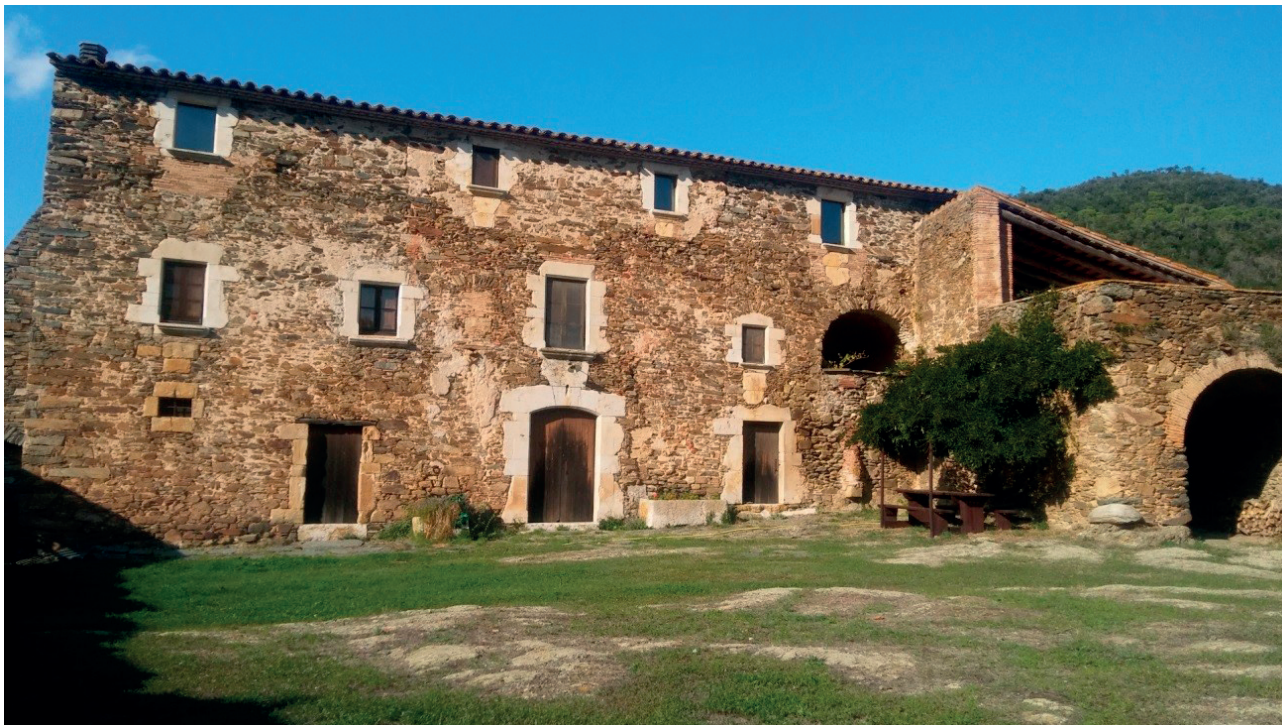
FIGURA 5. Façana actual del Mas Cals, amb tres portes d'entrada. La porta de l'esquerra, la finestra petita de més a l'esquerra i el davantal de la que té a sobre corresponen a la construcció del segle x de la casa esquerra citada al segle XIII, puix la porta presenta erosió derivada del salpàs, la qual cosa vol dir que era entrada de persones. L'arc del primer pis a la dreta correspon a l'eixida de la cuina de la casa de la dreta, també mil·lenària. Ambdues cases foren unificades en una sola façana amb obertures de pedra picada calcària de Fonteta a la darrera del segle XVIII amb diners del suro.

tura íntegra de la porta esquerra del pati, sense llinda com correspon a l'època; el davantal de la finestra de sobre; la finestra ferrada de més a l'esquerra, i una resta de porta central de tres elements, entre altres de situades al cos sortint del llenyer.