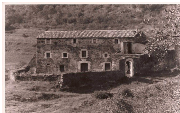
FIGURA 9. Estat de la casa en el moment de fer-me'n càrrec. Vaig tapiar les finestres altes i vaig tancar el pati com vaig poder.

Les obres consistiren a reedificar les façanes est i oest, afegint-hi un habitatge auxiliar, en comptes d'unes