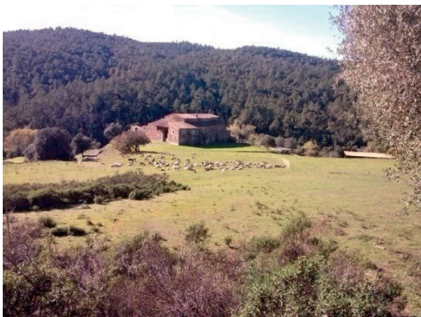
FIGURA 17. La masia i l'entorn donen una sensació d'atemporalitat, sense detalls que ens revelin a quin segle passa el que estem veient, amb unes rels profundes. Aquí una família, els Cals, hi ha viscut mil anys documentats, hi han anat adaptant l'habitatge a les necessitats seculars, amb la seguretat i l'autodependència com a divises. I ho han aconseguit. És un gran repte, ara per a nosaltres, poder assegurar-ne la perdurabilitat i fruit dels seus valors al segle XXI.

El patrimoni humà, i les masies en especial, en els EIN han sigut oblidades una vegada més. Després d'una època d'abusos urbanístics sense fre, resulta que el sòl rural de les masies conservades ha quedat dissecat, i els pagesos no en poden viure. Els valors antropològics que han deixat al llarg dels segles, tant al terreny com a la cultura i al caràcter, s'abandonen i es destrueixen en moments de pau i benestar. Tot es fa des d'un despatx urbanita, i la vida al camp, si no és de lleure, ni s'ajuda ni es comprèn.