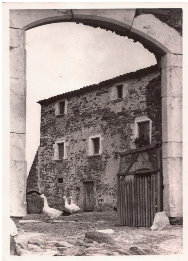
FIGURA 7. D'aquell temps ens queda aquesta bonica fotografia, amb les oques empordaneses al pati, que, com és ben sabut, són els millors guardians de la casa, tant pels crits —que avisen els estadants— com per l'agressivitat envers els visitants. (Fotografia: Quim Moragas, 1957.)

que aleshores no en sabíem res, de la història que acumulava la casa.