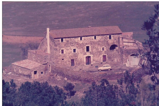
FIGURES 14 i 15. L'arranjament de la façana oest permeté una segona llar i, al mateix temps, una eixida amb balcó, en comptes de finestra, a un nou terrat de la casa noble.

rència incòmoda per a cases de l'autenticitat i austeritat com la nostra, amb corrent fotovoltaic i un entorn intoccat. Vers el 2005 vàrem començar a veure que el nostre model no s'adeia amb el propulsat per la Generalitat. Per contra, vacances d'estiu per a estrangers d'aquesta sensibilitat anaven bé.