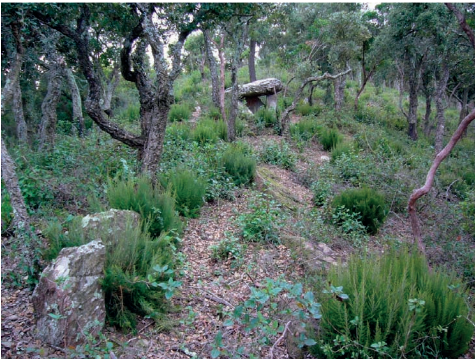
FIGURA 1. Dolmen dels Tres Peus. En primer terme, peces del cromlec que assenyalen el dolmen que veiem més lluny, i que al mateix temps fan de fita de propietat del Mas Cals, perquè en el temps de la delimitació romana de les finques els dòlmens es prengueren de referència. (Fotografia: Joan Botey, 2015.)

Si Fitor fou un lloc tan colonitzat en la protohistòria és perquè hi havia concentració d'habitants i riqueses apreciades aleshores. De fet, la densitat de monuments megalítics a la finca es altíssima. Ara, coneguts, en tenim vint-i-sis en unes mil hectàrees. El que passa és que hi ha un ecosistema de sureda tan frondós, i amb un creixement tan elevat, que embolcalla tot el que hi ha, fins que un, gestionant el bosc, ho «redescobreix».