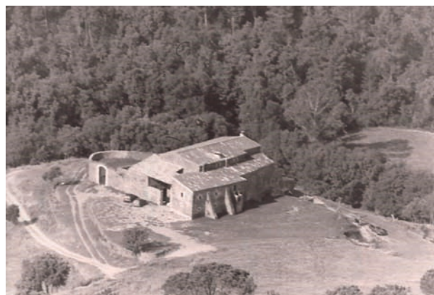
FIGURES 12 i 13. La façana est va haver de ser modificada; es donà una entrada auxiliar de serveis a la casa i es mantingué l'espectacular paller adossat amb una columna rodona central.