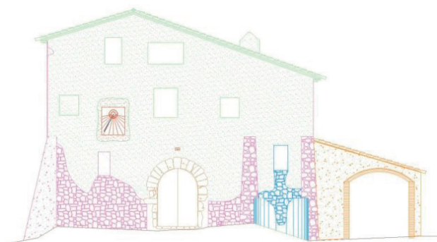
FIGURA 4. La documentació gràfica de cada una de les parts i elements que s'identifiquen en el conjunt de les estructures parietals d'un edifici permet disposar d'un registre documental que esdevé la base gràfica per a l'aplicació de qualsevol tipus d'estudi que sigui perceptiu realitzar sobre el conjunt arquitectònic que és objecte d'anàlisi. (Estudi historicoarquitectònic del mas de la Serra, a Vilatorrada. Isidre Pastor, 2013.)

Amb aquesta finalitat, en primer lloc es requereix procedir al registre i documentació de cada una d'aquestes estructures i dels elements que la componen per poder interpretar la seva dinàmica constructiva. La identificació, el registre i la documentació constitueixen un dels pilars metodològics de tota disciplina que interacciona amb l'element construït, com es fa des de l'arquitectura, l'arqueologia, la conservació i restauració, o altres disciplines afins. Aquesta pràctica