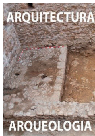
FIGURA 2. Des de la perspectiva de l'anàlisi històrica, l'arqueologia i l'arquitectura són dues disciplines que interaccionen, sovint, sobre un mateix element construït i, per tant, és pertinent poder-ne efectuar l'anàlisi i estudi a partir de l'aplicació d'un mateix mètode de registre i documentació, centrat i definit a partir de la relació física que s'estableix entre cada un dels elements, ja siguin constructius o estratigràfics. (Intervenció arqueològica a l'antic hospital de l'Hospitalet de l'Infant. Isidre Pastor, 2014.)

Més enllà de la contextualització històrica, susceptible de ser aplicada a qualsevol fet constructiu, aquest treball de recerca és complementari de qualsevol estudi o anàlisi tècnica que se'n pugui fer. Aquestes dinàmiques se centren a vincular aspectes propis de l'obra arquitectònica amb els que es refereixen a l'activitat