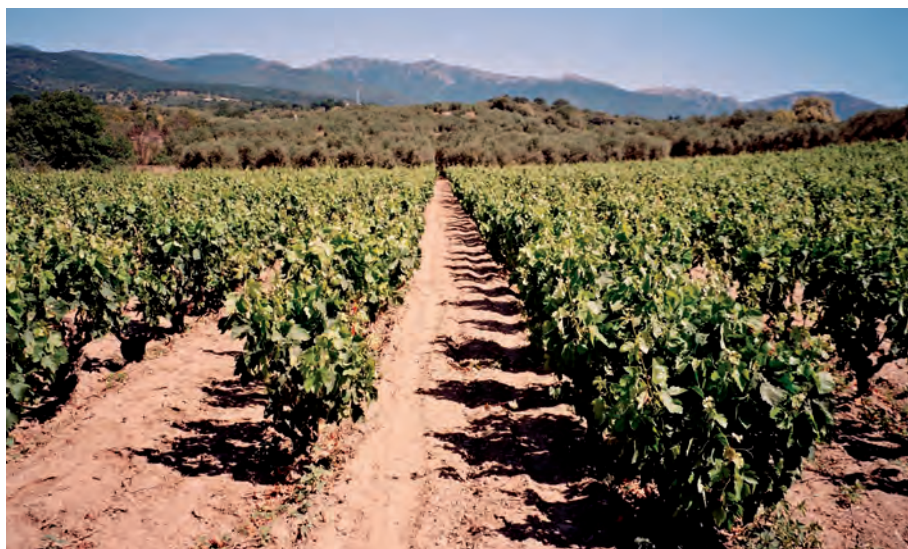
FIGURA 4. Carinyena conreada a la zona de les Alberes; filera de l'esquerra esporgada i la de la dreta no