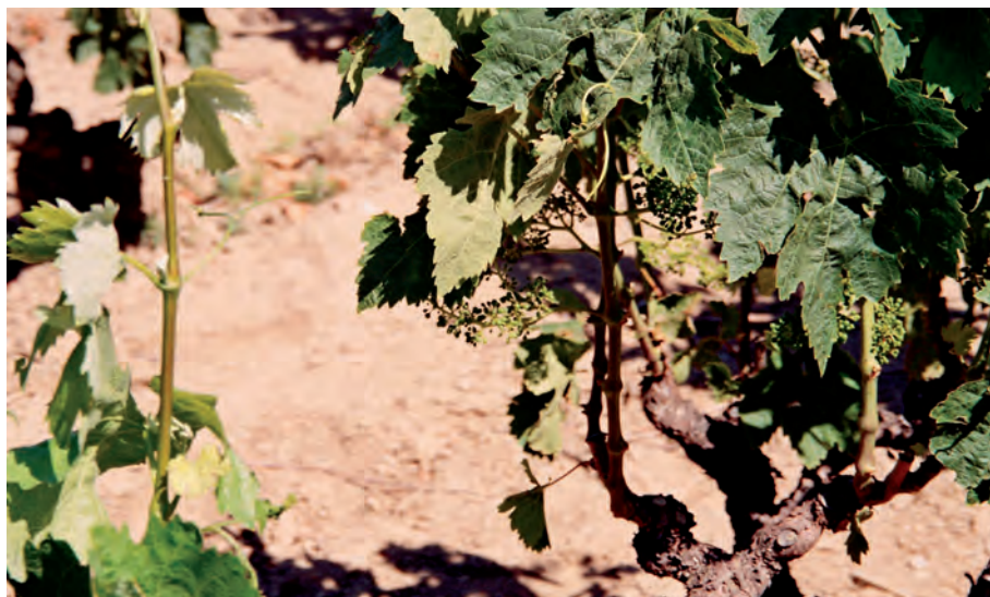
FIGURA 5. Eliminació de rebrots, cavalls i pàmpols fins a l'últim raïm. Espolla (Alt Empordà)