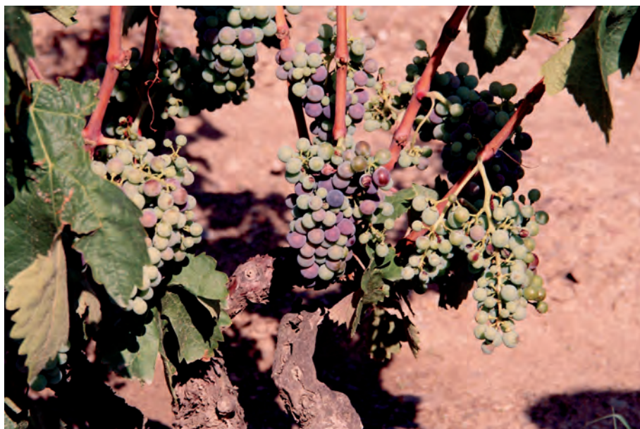
FIGURA 6. Carinyena en el moment del verolat. Espolla (2010)

Les operacions d'esporga en verd —eliminació de rebrots, supressió dels brots anticipats o cavalls, despampolat o aclarida de raïm— poden ser aconsellables segons el risc fitopatològic i el tipus de vi a elaborar.