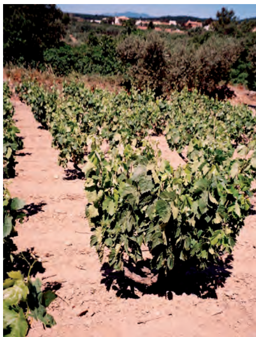
FIGURA 2. Conducció tradicional en vas de la carinyena. Espolla (Alt Empordà)