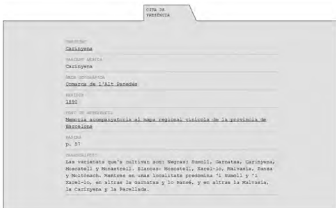
FIGURA 3. Fitxa de citació de presència en l'entorn web