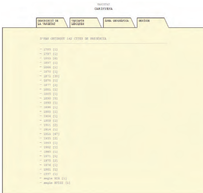
FIGURA 4. Pantalla de resultats de la varietat carinyena