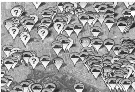
Fig. 3. Identificació d'armament, barreres i escamots (Síria, ●ctubre 2011).

davant d'un Tribunal Internacional? 2 És clar que ens cal una redefinició de la racionalitat política per a poder integrar aquest tipus d'actuacions a la xarxa. I que aquesta racionalitat es torna a basar en la dialèctica, en la discussió racional, en la paraula que interpreta les imatges, però que es basa en elles com a material bàsic d'observació, per a mantenir bé els peus sobre la terra i no permetre que el vol assassí d'Ate torni a substituir les imatges per abstraccions, busqui en aquestes el fonament de l'argumentació política, i acabi per fer-nos concloure que, efectivament, tenim tota la raó.