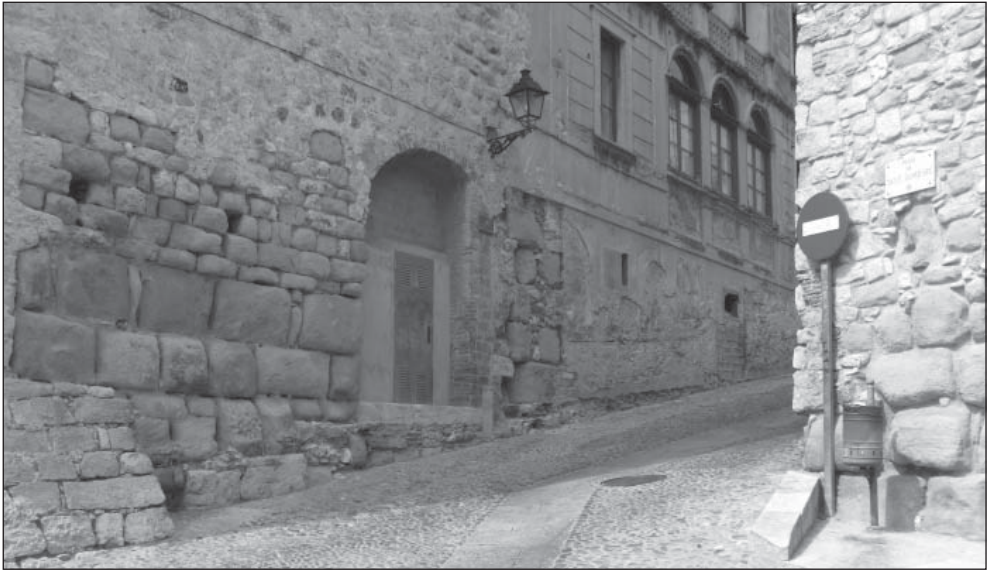
FIGURA 2. Sector del portal Rufí del recinte de la Força Vella en l'actualitat. Recordem que fou Serra-Ràfols qui l'identificà i explorà.