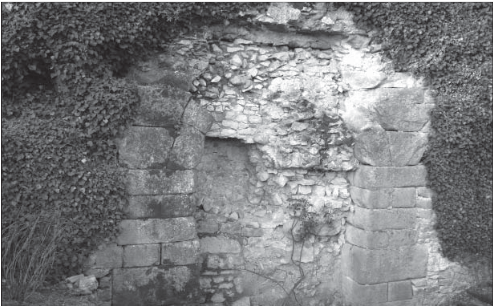
FIGURA 3. Estat actual de la porta del castell de Gironella que descobrí Serra-Ràfols. Ara sabem que probablement era la porta de llevant del recinte tetràrquic aprofitada i desplaçada pels constructors carolingis.