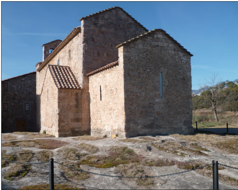
Figura 3. Vista de la capçalera de l'església de Sant Vicenç d'Obiols (Avià, Berguedà) i del cementiri circumdant (J. Gibert).

banda, i malgrat no disposar de dades estrictes per a la Catalunya Central, el recurs a alguns exemples propers 50 ens mostra com, pel que fa a l'evolució en l'ús d'aquests cementiris, el nombre proporcional de tombes creix ostensiblement a partir del segle XI, un fenomen que ha de respondre al definitiu abandonament de les necròpolis rurals i a la instauració dels cementiris eclesiàstics com a espai únic i exclusiu d'enterrament.