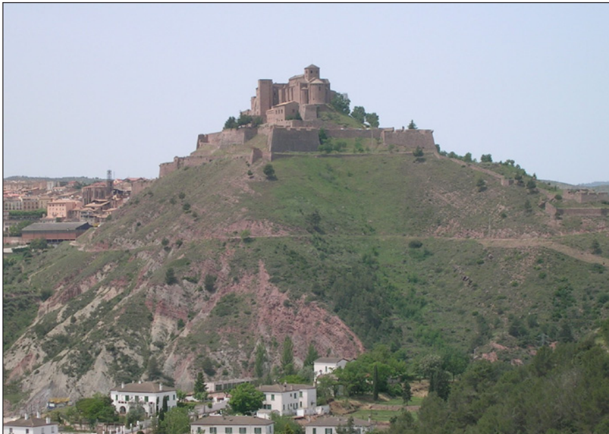
Figura 6. Vista de l'emplaçament del castrum Cardonam documentat des de finals del segle VIII, avui amb l'església de Sant Vicenç i les fortificacions baixmedievales i modernes (J. Gibert).

ques anteriors, i on considerem clau la participació i la implicació, al costat de les elits dominants, de les comunitats pageses en aspectes com la defensa. En aquest sentit, totes les dades apunten vers una primacia en aquestes dates d'enclavaments que, com Cardona, documentat d'ençà de finals del segle VIII, 74 presenten clares funcions defensives a la vegada que exerceixen de nuclis territorials capaços de gestionar en el seu benefici un context aparentment complicat, una situació que, en el cas cardoní, sembla estendre's fins més enllà de mitjan segle X malgrat la seva integració formal en l'òrbita comtal en temps de Guifré el Pilós (figura 6).