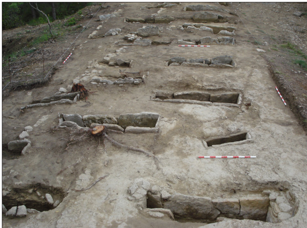
Figura 2. Vista des del nord de la necròpolis de Pertegàs (Calders, Bages) (J. Gibert).