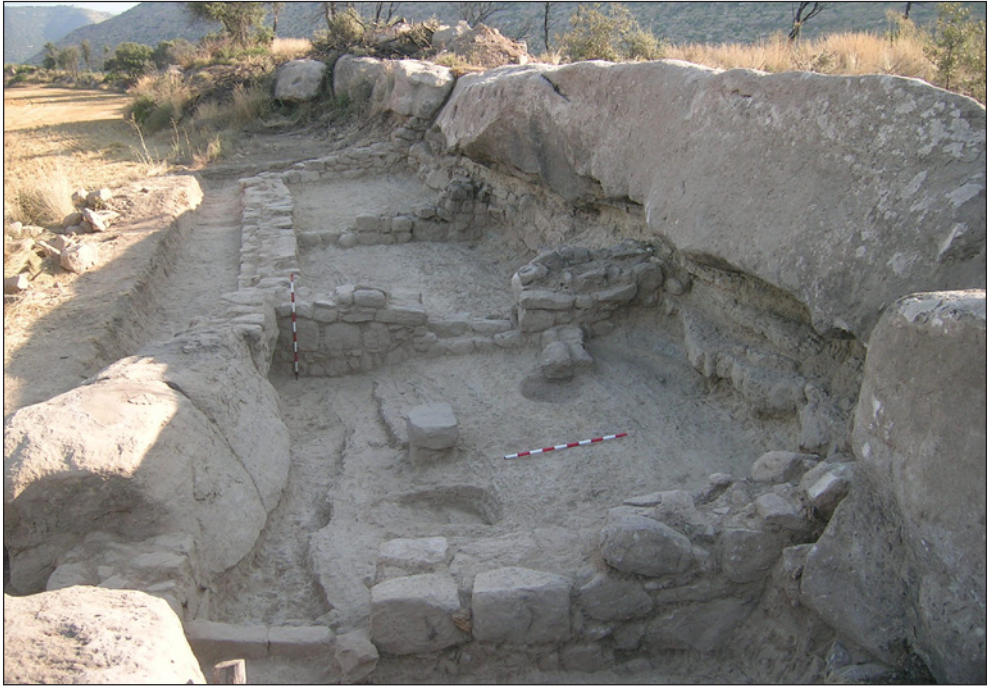
Figura 5. Vista del jaciment del Collet de les Caixes (Navàs, Bages) des del sud (J. Gibert).

ciable estandardització de la producció constitueixen aspectes que serveixen per proposar la inclusió d'aquest establiment sota l'òrbita i en benefici de la instància senyorial. 66