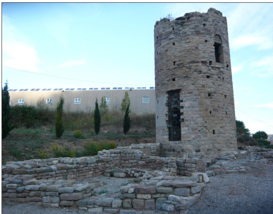
Figura 4. Torre de la Pobla o del Fusteret (Súria, Bages), amb estructures posteriors adossades (J. Gibert).

ria, especialment les actuals zones de l'Alta Anoia i del Baix Solsonès, s'acompanyaria inicialment de l'establiment de torres amb terme a l'extrem dels castells fronterers, emplaçaments on comtes i vescomtes, però també altres magnats laics i institucions eclesiàstiques, hi instal·len senyors fidels, els quals es beneficien de les rendes, fins i tot la dècima, i dels serveis adscrits a l'alou en qüestió. No obstant, podem pensar que els senyors d'aquests alous devien obtenir els majors beneficis en raó de taxes proporcionals a les collites. Així, les torres es diferencien dels castra , pensem, en el sentit que, mentre que els segons basen els seus drets en la jurisdicció sobre un terme, dins el qual el senyor del castell pot ostentar la propietat d'un nombre determinat de terres al costat d'altres terratinents, les competències de les primeres impliquen la propietat directa sobre la totalitat de les terres, coincidint en uns mateixos límits amb el desplegament de drets jurisdiccionals. Per tant, aquests alous amb torre, en alienar-se, poden ser tractats com el que també són, grans explotacions agrícoles on s'apliquen taxes proporcionals sobre la seva producció global, habitualment la tasca.