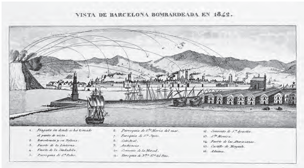
FIGURA 4. Atles de Barcelona , núm. 481. Gravet de Domènec Estruch publicat en el full volant Vista de Barcelona bombardeada en 1842 , Barcelona, imp. de Tomàs Gorchs.

Estruch és autor d'una Vista meridional de la ciutat de Barcelona que forma part d'un conjunt de vistes de poblacions catalanes editades durant la primera guerra carlina, al voltant de 1837. 15 La planxa de coure amb la vista de Barcelona fou retocada pel mateix gravador el 1842 per adequar-la a una nova publicació: un full volant imprès per Tomàs Gorchs en què es resumien els fets del bombardeig 16 . Els retocs van consistir a afegir les bombes i les seves trajectòries sobre la ciutat, així com el fum dels incendis, i a ampliar el gravat per la banda de Montjuïc, representant el castell que abans no hi figurava. Una atenta inspecció al gravat permet distingir una lleugera línia vertical, allà on la part nova fou afegida (Fig. 4). Encara podem sumar-hi una litografia semblant continguda en l'obra Sucesos de Barcelona . 17