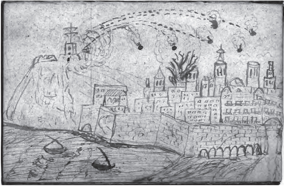
FIGURA 1. Dibuix inèdit del bombardeig de Barcelona (1842).

anys dels segle XIX, com el de Sellent de 1806, 5 però a partir de 1807 canvia d'aspecte i queda substituït per un pal vertical amb dos travessers, com mostra un altre gravat 6 i tots els posteriors, i també el nostre dibuix. Aquest element quedaria integrat el 1849 en la xarxa de telegrafia òptica espanyola, decretada pel govern el 1844, i també en la xarxa urbana que comunicava els aquarteraments de Barcelona: Montjuïc, Drassanes, Ciutadella, Marquès de la Mina i Capitanía General, establerta el 1848 pel coronel Leonardo de Santiago. 7