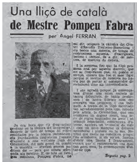
Fig. 2. Foc Nou , núm. 17, 30 de desembre de 1944.

Aprofitant l'anada de Fabra a Tolosa de Llenguadoc, el número de 23 de desembre de Foc Nou va deixar constància de dos actes a què va assistir el Mestre, al qual la crònica qualifica d'«artífex indiscutible» i «il·lustre restaurador de la llengua catalana» (p. 3). El primer va ser a l'esmentat Casal Català d'aquesta ciutat, en el qual, a més de pronunciar-hi la dita conferència, se li va oferir una recepció, «on un gran nombre de catalans» va manifestar-li «la seva admiració i estima» (Jané i Mir, 2013: 832). I el segon acte va ser una visita a la redacció de Foc Nou . El número 17 (publicat el 30 de desembre 1944) d'aquesta capçalera feia un seguiment d'aquella conferència amb la notícia «Una lliçó de català de Mestre Pompeu Fabra» (p. 1), signada per Àngel Ferran: