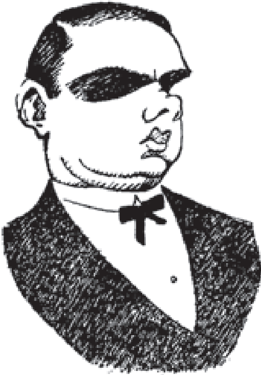
Autocaricatura de Feliu Elias publicada en el calendari de 1911 del Papitu .

emplaça per altres mecanismes de percepció i comprensió. Un altre factor essencial de la caricatura, ultra el seu format visual, és el seu to humorístic. L'humor ofereix un ampli ventall de recursos, de la sàtira més mordaç a la lleugera ironia, passant per la comicitat poètica o el contrasentit més o menys graciós. Sigui com sigui, el registre humorístic permet la distorsió, la transgressió, car retrata la realitat en un mirall deformant i fantasiós, no sotmès a les normes que ha de complir qualsevol altre material periodístic. En aquestes imatges humorístiques o satíriques, el dibuix suma les connotacions estètiques a les semiòtiques. Al contrari de la il·lustració, sempre lligada a un text, els dibuixos de les vinyetes satíriques es poden comprendre de forma independent a la resta del contingut informatiu de la pàgina en la qual van ubicats, si bé moltes vegades les vinyetes es refereixen als temes de l'actualitat més recent. La intenció d'aquestes vinyetes és aportar una reflexió despreocupada, una visió crítica o satírica, de vegades tendra i altres vegades ferotge de la realitat.