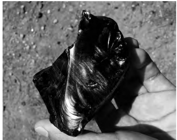
Figura 6. Aspecte de visu d'obsidiana de la varietat daurada, d'interès gemmològic, del Cerro de Las Navajas, Epazoyucan (sector sud-oest del Geoparc Comarca Minera).