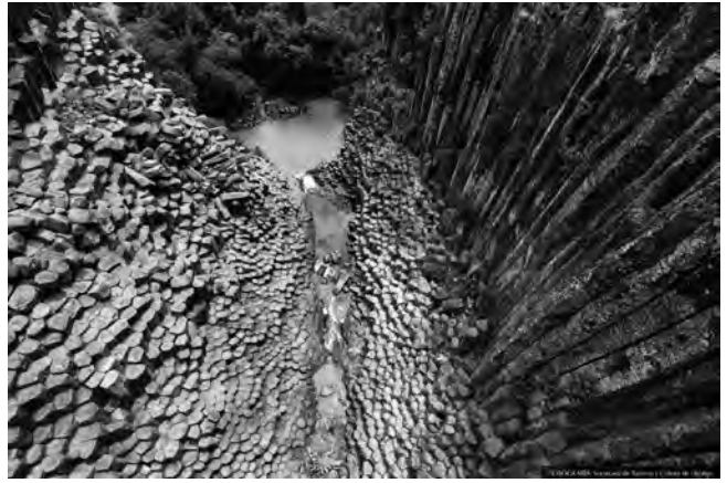
Figura 5. Vista aèria del geosite Prismas Basálticos de Santa María Regla, Huasca de Ocampo. Un magnífic exemple de disjunció columnar i icona turística del Geoparc Comarca Minera i de l'Estat d'Hidalgo.