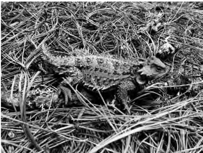
Figura 4. Rèptil conegut com «camaleón mexicano» o «camaleón de montaña» ( Phrynosoma orbiculare (Linnaeus, 1789)), espècie protegida que encara és abundant als herbassars i pinedes de muntanya del Geoparc Comarca Minera.