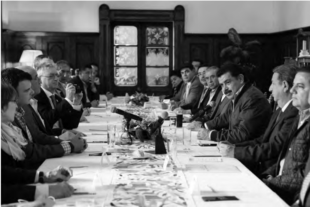
Figura 8. Recepció oferta pel c. José Francisco Olvera Ruiz, Governador Constitucional de l'Estat d'Hidalgo (a la dreta de la taula, parlant amb micròfon) va oferir als revisors de la UNESCO i a les autoritats universitàries (a l'esquerra de la taula) el dia 21 de juny de 2016 a la Ex-hacienda La Concepción (municipi de San Agustín Tlaxiaca, Hidalgo).

carta de suport signada per l'ambaixadora Socorro Rovirosa, secretaria general d'aquesta comissió.