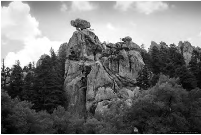
Figura 2. Formacions rocalloses volcàniques (riolita) del geosite Peñas Cargadas, Mineral del Monte; els arbres a segon terme són exemplars d'oyamel ( Avies religiosa ).