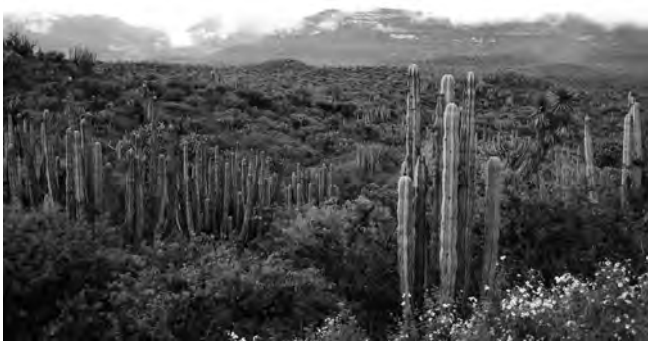
Figura 3. Matollar xeròfil ric en cactàcies de la Barranca de Metztitlán (Reserva de la Biosfera), al sector septentrional del Geoparc Comarca Minera. El cactus columnar es Pachycereus marginatus (DC.) Britton & Rose i la yuca Yucca filifera Chabaud.