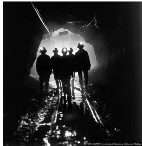
Figura 7. L'esperit de la mineria impregna tots i cadascun dels racons del Geoparc Comarca Minera.