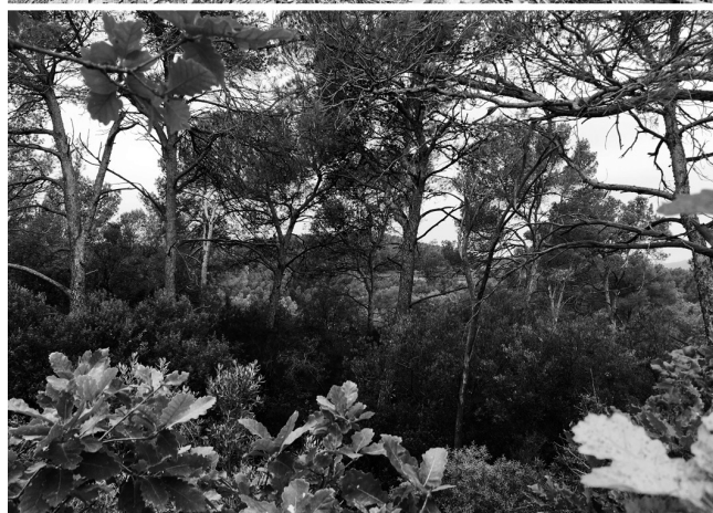
Figura 1. Vista general de la vegetación dominante en el área de estudio desde el sotobosque y dosel.

Distribución: especie bien distribuida en la región paleártica occidental. Este ejemplar supone la primera cita para España; en la Península Ibérica sólo se conocía del sur de Portugal (Starý (2014).