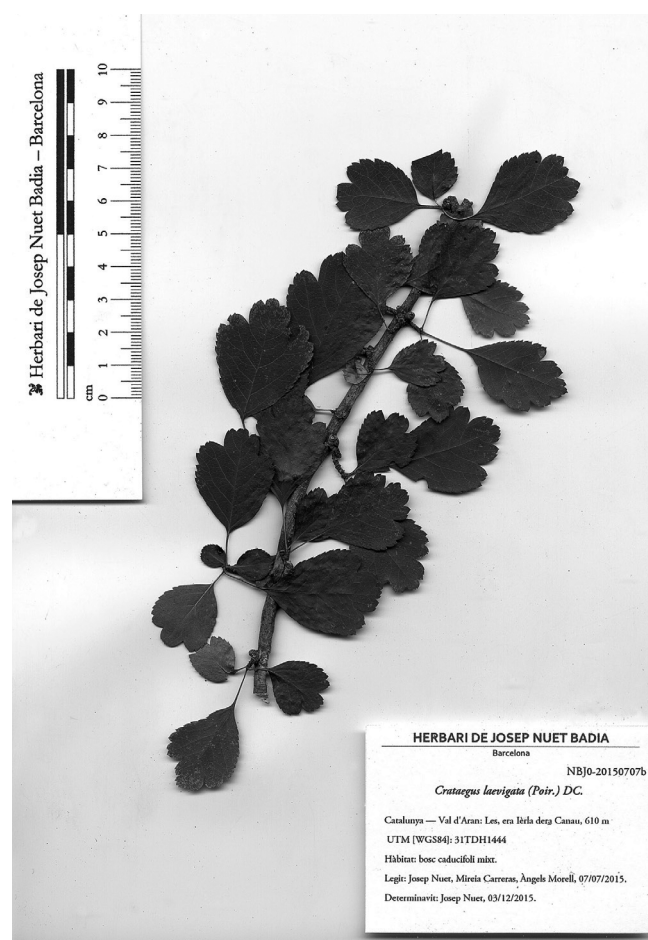
Figura 1. Plec d'herbari de Crataegus laevigata (Poir.) DC. (BC 950953).

Bolòs & Vigo (1984: 420) diuen que C. laevigata ha es-