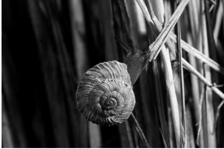
FIGURA 1. Xerocrassa montserratensis betulonensis de la Serralada de Marina.

màtica de la contrada, Xerocrassa montserratensis betulonensis (Fig. 1), hi ha referències en treballs com Thieux (1907), Altimira (1971), Martínez-Ortí & Uribe (2008) i Martínez-Ortí & Bros (2011).