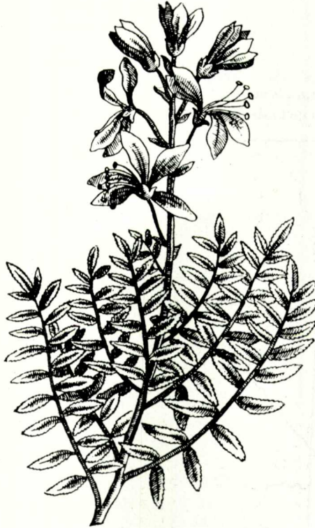
Fig. 4. " Dictamnus albus Off. minor hisp.", de Barrelier

Aquesta figura de BARRELIER és la que reproduïm aquí per a millor intel·ligència. Notable és que LAMARCK havent