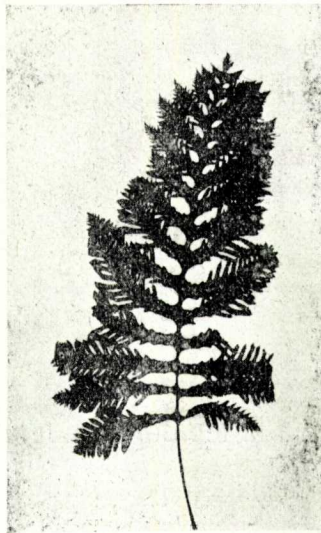
Fig. 3. Pol. cambricum típic, de l'Herbari F. X. Bolós, 1: 4.

Finalment la forma cambricum té un caràcter de permanència abastament provat, puix segons ASCHERSON i GRAEBNER (obra citada) fa més de 200 anys que s'ha mantingut cultivada en els jardins botànics. Al meu entendre, la indicació de localitat, que porta l'exemplar de l'herbari Francesc X. Bolós, demostra això mateix. L'exemplar procedia del jardí botà-