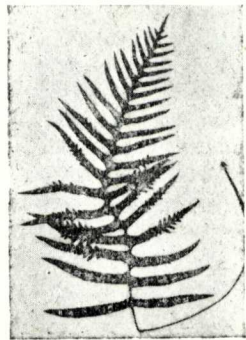
Fig. 2. Pol. serratum f. subcambricum , d'Olot, 1:9.

Entre les formes més o menys bipinnades corresponents a l'espècie propiament dita hi ha la pinnatifida Wallr. i la omnilacera Moore. I com a forma bipinnada corresponent a la subespècie, hi ha la forma cambricum Willd. "homòloga de la pinnatifida ", segons els esmentats autors. Partint d'aquest