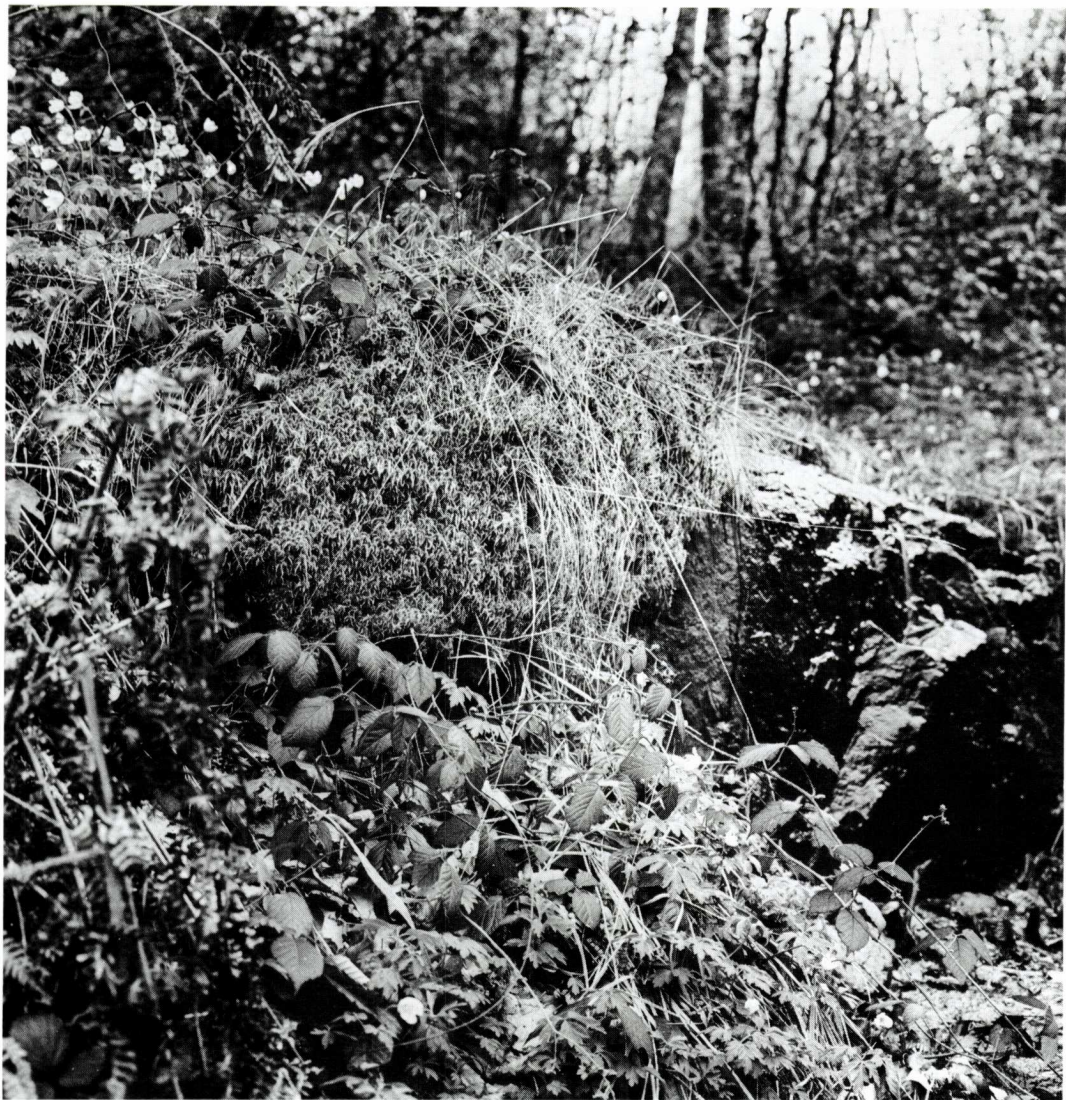
FIG. 2. Una vista de la mullera amb esfagnes dins la fageda. L'esfagne forma un coixí arrapat a la roca (foto: J. Nuet Badia, 30-4-79). A view of the fen with Sphagnum in the beech forest. The Sphagnum lies like a small cushion glued to the rock.

Schpr., determinació que segons la Dra. Casas de Puig no ha pogut ser comprovada.