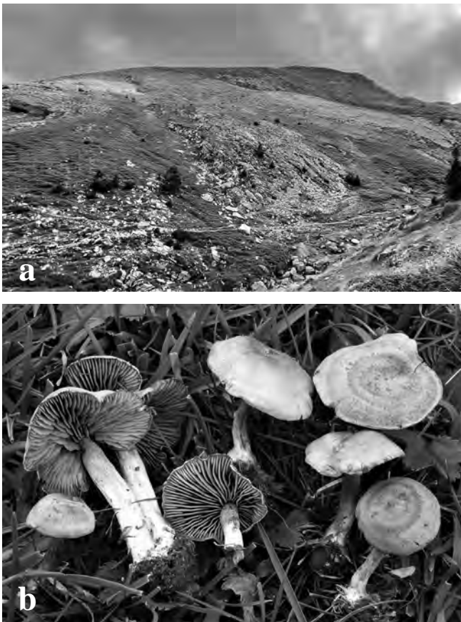
Figura 5. a) Locis tipus d' Entoloma muscoalpinum, Ras de l'Ortigar (Núria) ; b) Entoloma muscoalpinum (JVG 1140827-1)

1140805-25). Comentaris: freqüent en prats alpins i subalpins, no sembla estar present en zones més baixes. Té el píleu densament fibrillós i de color molt fosc, a vegades gairebé negre, que contrasta molt amb el color blanquinós de les làmines joves.