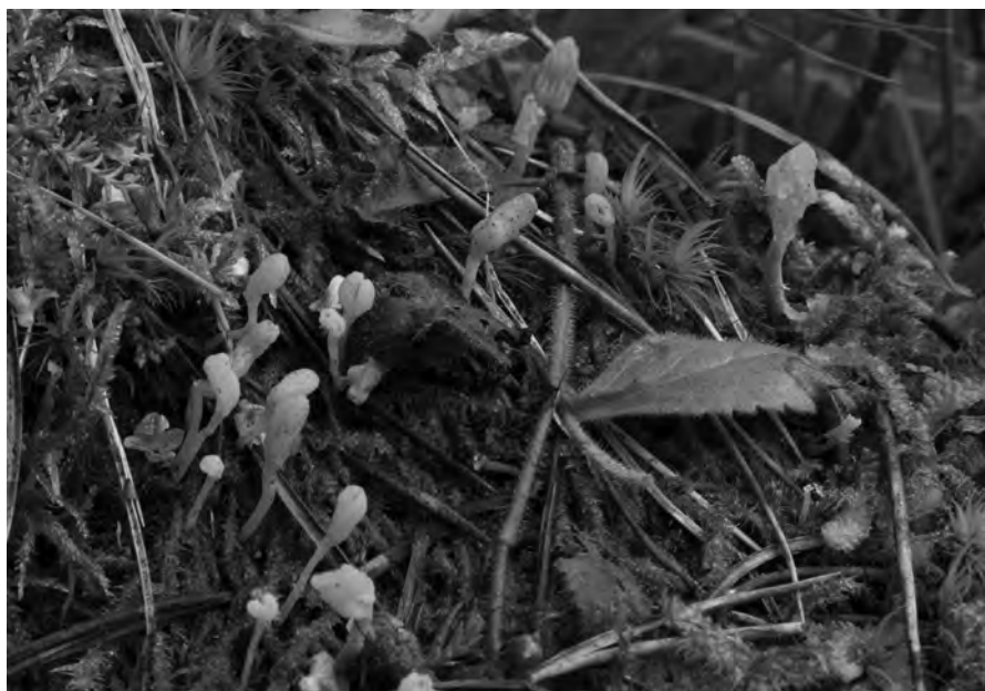
Figura 2. Bryoglossum gracile (LE 304006)