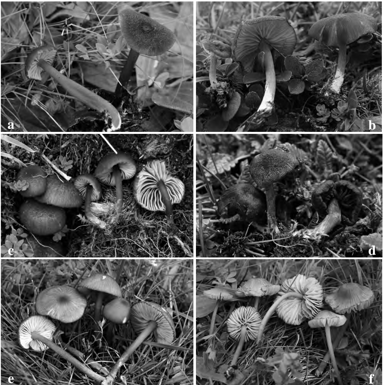
Figura 3. a) Entoloma anatinum (LE 312423) ; b) Entoloma aranense (LE 312428) ; c) Entoloma asprellum (JVG 1130830-14) ; d) Entoloma azureopallidum (LE 312505) ; e) Entoloma catalaunicum (LE 312420) ; f) Entoloma exile (LE 312434).