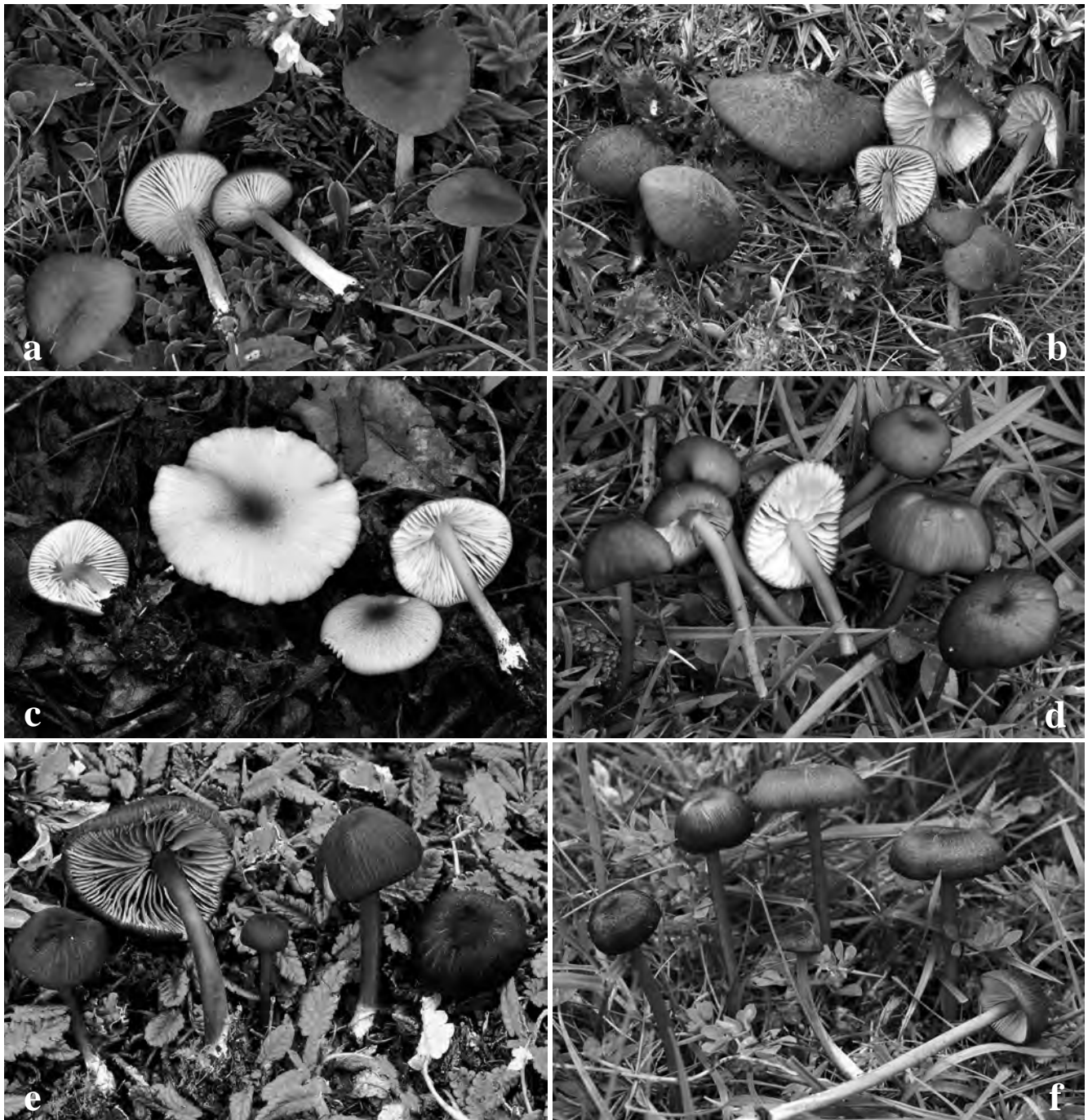
Figura 4. a) Entoloma fridolfingense (JVG 1140916-10) ; b) Entoloma glaucobasis (JVG 1140805-23) ; c) Entoloma glaucodubium (JVG 1140829-7) ; d) Entoloma minutigranulosum (JVG 1140805-5) ; e) Entoloma montanum (JVG 970827-14) ; f) Entoloma porphyrogriseum (LE 312433).

Entoloma polioopus (Romagn.) Noordel. - Pardines (23), bosc de Corylus avellana , Buxus sempervirens , Fraxinus excelsior i Sorbus aria , sobre sòl bàsic, 29 VIII 2014 (JVG 1140829-5). Comentaris: fructifica en boscos o brolles, desde l'estatge subalpí a la zona mediterrània. No l'hem observat en prat. Els exemplars més típics tenen el píleu grisenc i l'estípit blavós, però es tracta d'un tàxon molt variable, no sempre fàcil d'identificar.