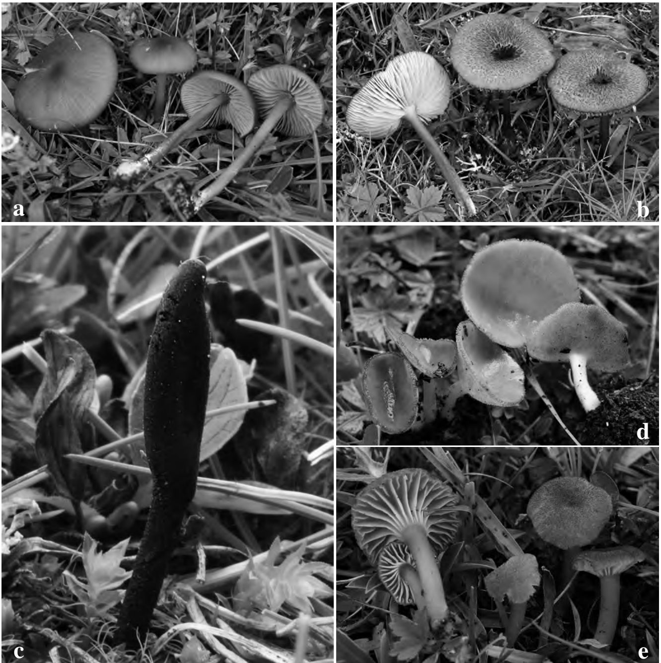
Figura 6. a) Entoloma turci (LE 312465) ; b) Entoloma viidense (JVJG 1140926-31) ; c) Geoglossum fallax (LE304016) ; d) Helvella fibrosa (LE 304009) ; e) Hygrocybe turunda (LE 295071).

Santuari (16), prat, sobre sòl àcid, 27 VIII 2014; Pardines (19), prat, 29 VIII 2014.