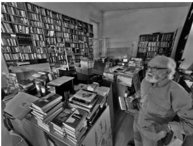
Figura 6. La gran biblioteca que ha anat ornant al llarg de la seva vida per a documentar-se per als seus articles i llibres.

I ja està. Però confessa que això l'ha empès a acostar-se a peu a aquestes contrades (Fig. 3) i que continua essent la millor manera de conèixer i escoltar els informants que estan desapareixent. Actualment, anar-hi a l'encalç (a atrapar-los) requereix posar-hi habilitats periodístiques i fins i tot, assegura, detectivesques. Així mateix, sempre que pot no perd l'ocasió de recollir algunes peces d'artesanía o estris de les feines més curioses, moltes d'elles desaparegudes. Les reuneix en una mena de museu a casa seva i han servit per fer diverses exposicions (Fig. 4)