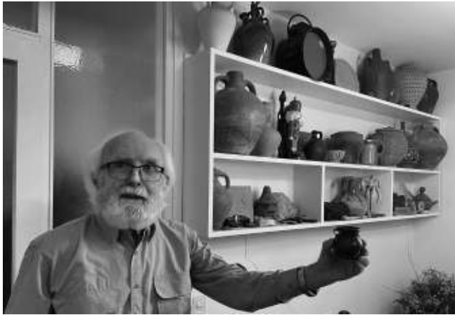
Figura 4. Part del seu museu particular de Fontcoberta, que conté estris recollits arreu dels Països Catalans.