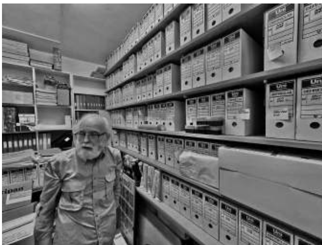
Figura 5. El seu enorme arxiu, que conté milers de notes, informes, articles, etc. meticulosament ordenats.