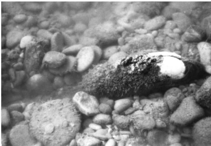
FIGURA 3. Margaritifera auricularia al riu Ebre. Aquest exemplar representa la mida màxima observada (15 cm de longitud), que correspon a una edat d'uns 100 anys. Noteu els umbons (la part més vella de la conquilla) erosionats, i la remodelació intensa que provoca al fons amb el seu desplaçament.

This riffle along the lower Ebro, exposed during a period of very low water level in August, is one of the last remaining habitats able to host high densities of Margaritifera auricularia . Often the shores of this river have been filled to gain agricultural fields.