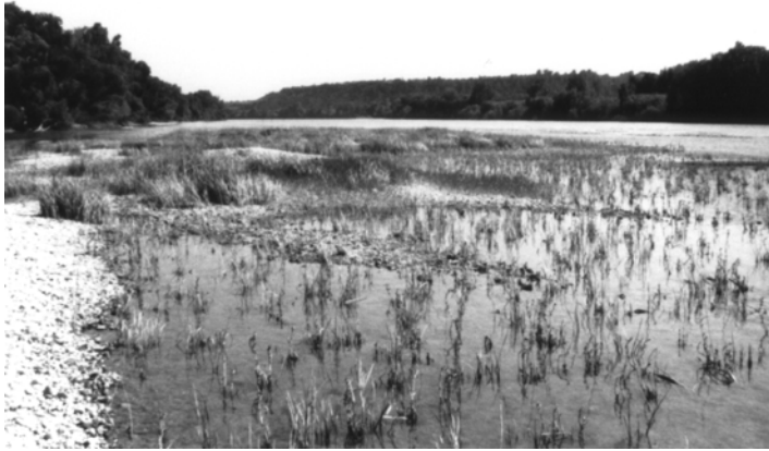
FIGURA 2. Aquest codolar al curs baix de l'Ebre, exposat durant un període de nivell molt baix a l'agost, és un dels darrers hàbitats capaços de mantenir elevades densitats de Margaritifera auricularia . Sovint les vores d'aquest riu han estat aterrades per guanyar terrenys de conreu.

This riffle along the lower Ebro, exposed during a period of very low water level in August, is one of the last remaining habitats able to host high densities of Margaritifera auricularia . Often the shores of this river have been filled to gain agricultural fields.