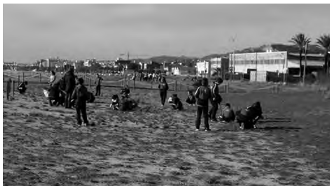
Figura 2. Escolars de Malgrat fent la sembra de les espècies.

Així mateix, els escolars també van recollir deixalles de la platja i van arrencar-ne Carpobrotus , tot plegat amb la dinamització de monitors i de voluntaris del grup de ciència ciutadana local. Tot plegat es va desenvolupar sobre una superfície de 4,5 hectàrees.