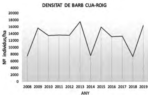
Figura 1. Densitat de la població del barb cua-roig a la riera de Vallvidrera, tram 500-600 m entre Can Modolell-Can Castellví, des del 2008 fins a l'actualitat.

funció del cabal: els anys amb menor cabal (2019), els peixos queden concentrats en unes àrees més petites i això n'afecta l'alimentació, la reproducció i l'estructura d'edats de la població (disminueix la proporció de juvenils per fracàs reproductiu). Els estudis demostren la fragilitat de la població del barb cua-roig de la riera de Vallvidrera al sector de La Rierada. Es tracta d'una espècie molt sensible a la contaminació i a la variabilitat del règim hidrològic de la riera. Qualsevol alteració en l'estructura de l'hàbitat en els trams de riera on habita pot comportar el declivi i extinció local de l'espècie.