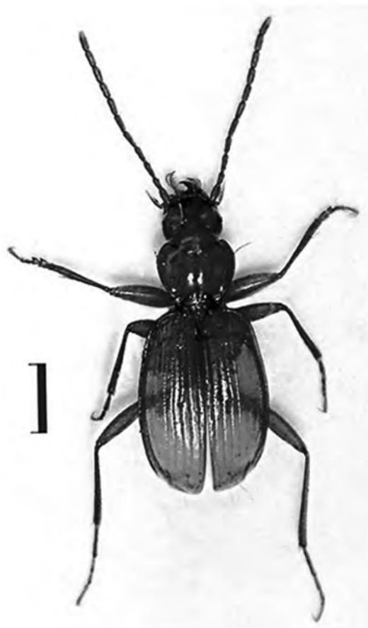
Figura 1. Trechus guijonensis n. sp. Habitus. Escala = 1 mm.

Espècie situada en el grup de T. austriacus tal com fa constatar Ortuño (2004), propera a T. barratxinai de la que es dife-