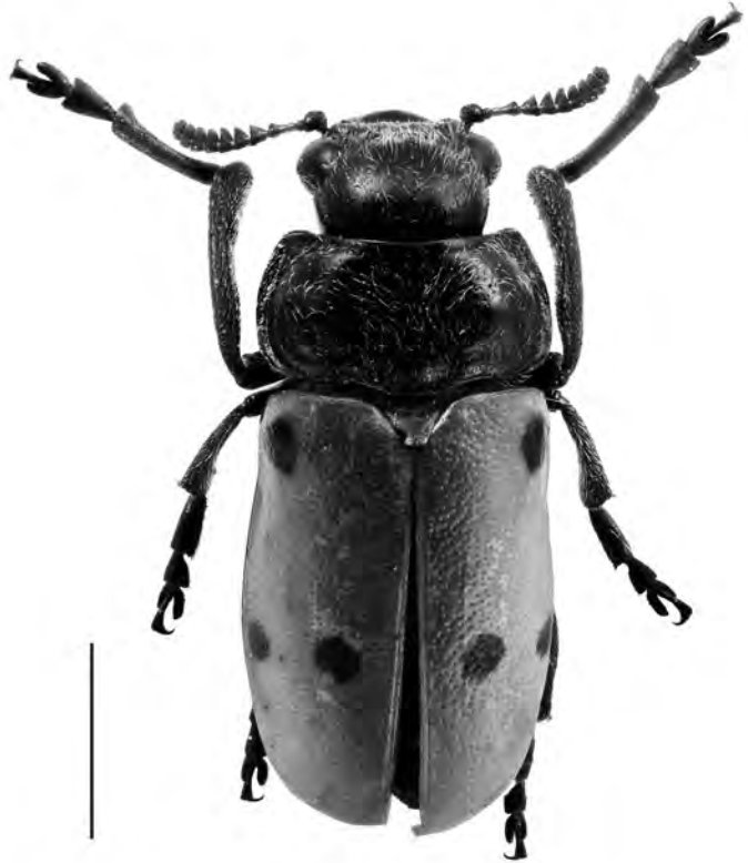
Figura 7. Lachnaia (Lachnaia) paradoxa (G.A. Olivier, 1808) de Blanes. Escala = 3 mm.

Espècie centre europea amb una distribució discontinua, a la Península Ibèrica estava citada només de l'àrea pirinenca (Vázquez, 1993, 2002). De l'àrea catalana s'ha citat de Girona (Camprodon) i Lleida (Aigües Tortes, Betren, Planes de Son, Sant Joan de l'Erm i vall de Toran) (Agulló et al. ,