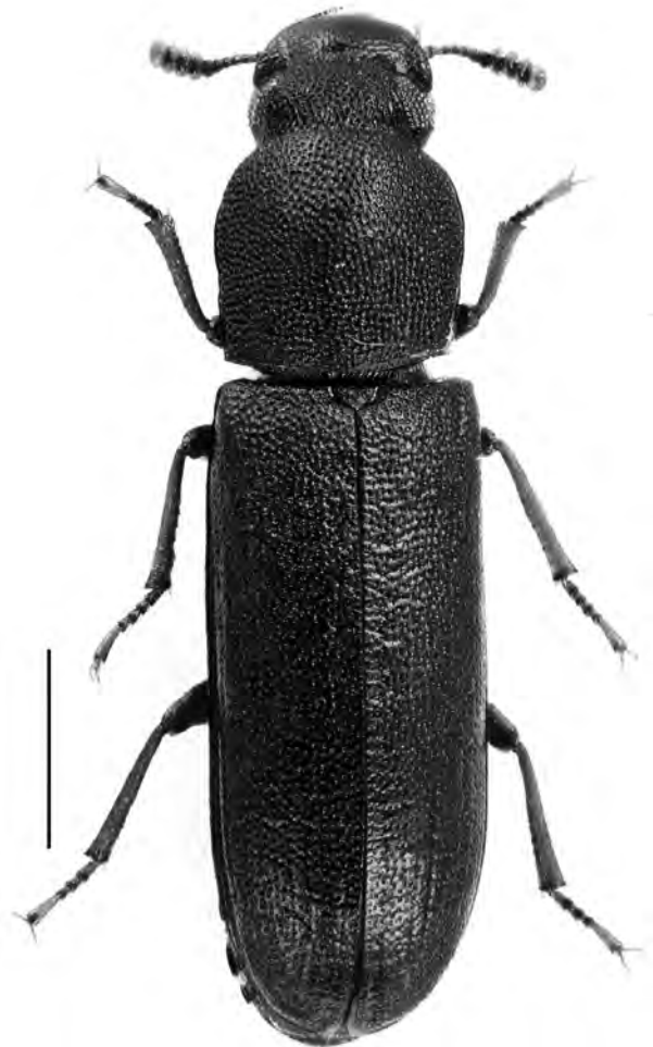
Figura 6. Lyphia tetraphylla (Fairmaire, 1857) de Blanes. Escala = 1 mm.

ex. «16-VII-2018, Turó del Vilar, Blanes, Girona, A. Perich, C. Tobella & P. Pons leg.» (AV).