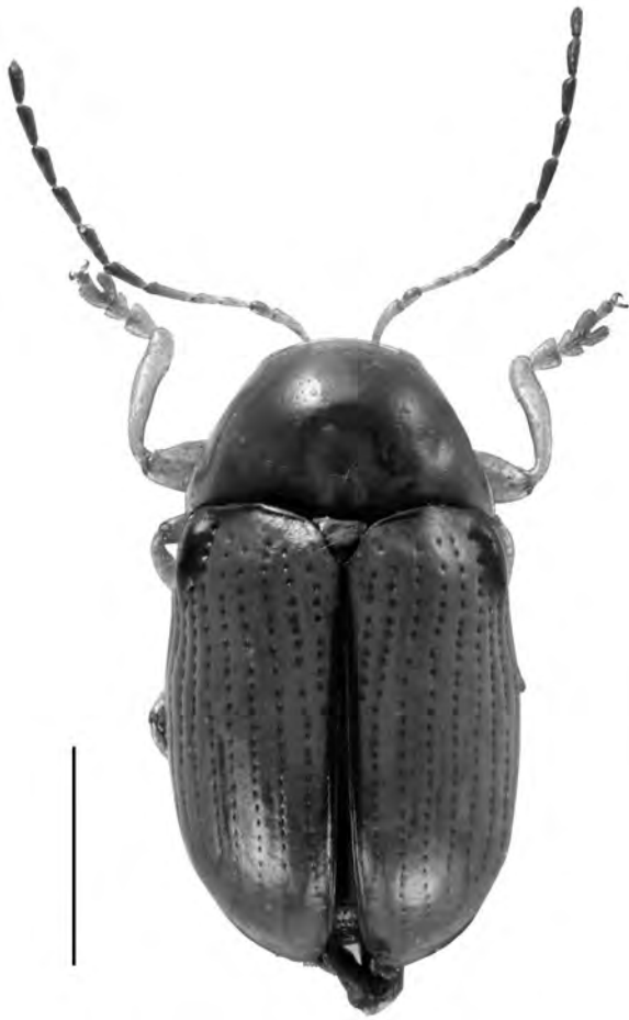
Figura 8. Cryptocephalus (Burlinus) pusillus Fabricius 1777 de Fogars de Montclús. Escala = 1 mm.