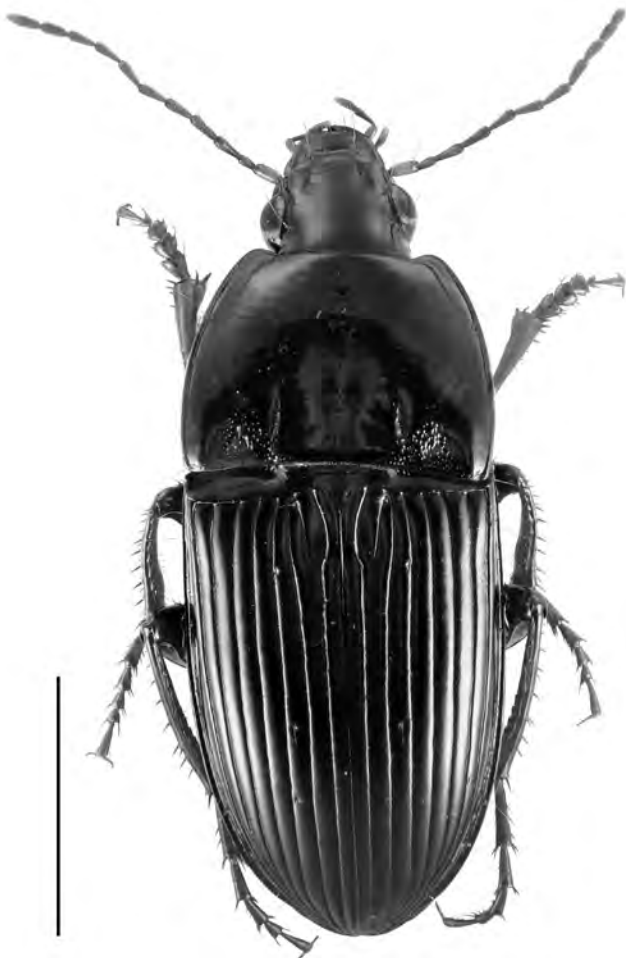
Figura 2. Orthomus (Orthomus) barbarus formenterrae Breit, 1933 de Formentera. Escala = 3 mm.

Interessant endemisme propi de l'illa de Formentera, descrit amb un ♂ i una ♀ recol·lectats a la Mola per Gasull i Palau respectivament. No hem pogut localitzar citacions de l'espècie posteriors a la seva descripció, tampoc està contemplada la seva presència a l'illa en el catàleg balear de Serrano et al. (2018), pel que creiem que és molt interessant aquesta nova localització ja que confirma que aquest endemisme segueix present a l'illa