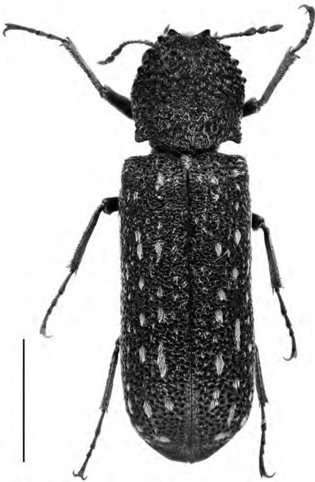
Figura 3. Lichenophanes numida Lesne, 1899 de Blanes. Escala = 3 mm.