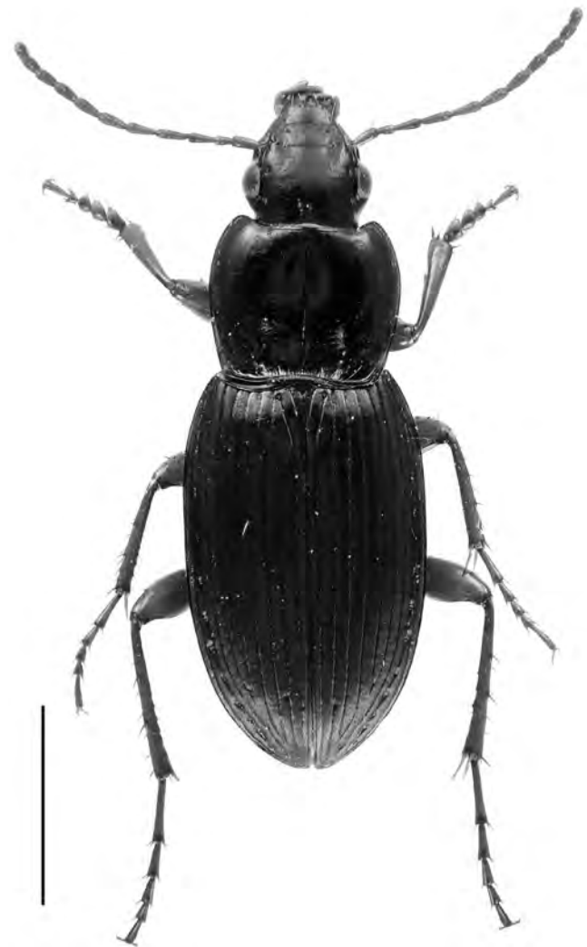
Figura 1. Platyderus (Platyderus) formenterae Jeanne, 1988 de Formentera. Escala = 2 mm.

1 ♂, etiquetat: «4-III-2019, Sant Francesc de Formentera, 31SCC6285, Formentera, A. Viñolas leg.» (AV).