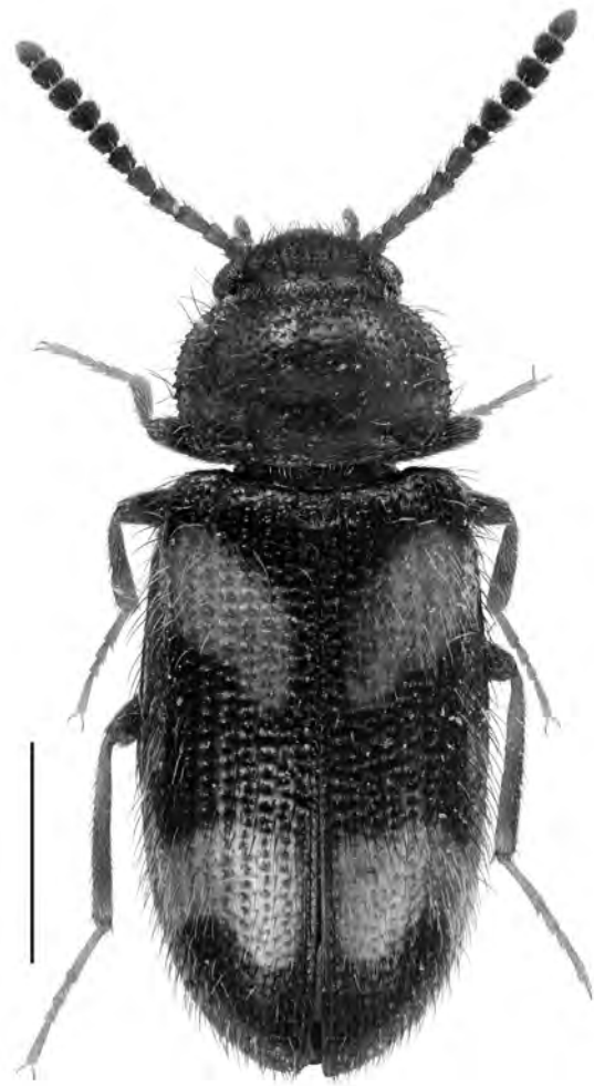
Figura 4. Mycetophagus (Mycetoxides) fulvicollis fulvicollis Fabricius, 1792 de Fogars de Montclús. Escala = 1 mm.

bla et al. , 2007). L'adult és pot localitzar entre els mesos de maig a agost.