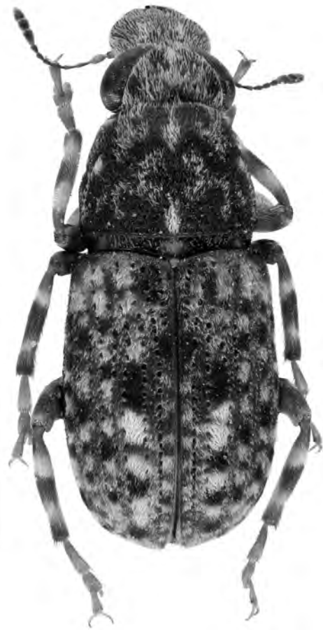
Figura 9. Ulorhinus bilineatus (Germar, 1819) de Fogars de Montclús. Escala = 1 mm.

(MZB 2008-0811, 2008-0805); 2 ex. «25-VI-2010, Delta del Llobregat, Riera de Sant Climent, Viladecans 6 m, N41°17'10,6" E2°03'15,3"', J. M. Diéguez leg.» (MZB 2010-1783, 2010-1784).