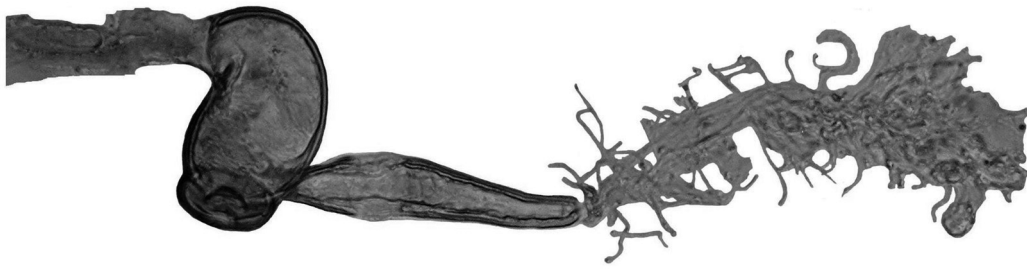
Figura 2. Microtyphlus mesegueri n. sp., complex genital femení, amb l'espermateca i la glàndula annexa.

Èlites doble llargs que amples, de costats subparalels, la zona humeral arrodonida i prevista de petites dents a la vora externa que continuen més enllà de la meitat de la vora elitral. Zona apical lleugerament truncada formant un petit angle sutural. Tota la sutura finament vorejada. Disc elitral bastant convex i amb microreticulació, a més de vàries petites setes daurades disposades longitudinalment, més alineades a la part externa de cada èlitre. Nou grans setes umbilicades a la vora lateral de cada èlitre, la tres primeres a la zona humeral, la següent a la meitat elitral, la cinquena a la vora del terç apical, la sisena i setena al quart apical elitral, la vuitena i la novena a la vora de l'apex elitral. Té grans setes alineades a la part central del disc. Escudet ample i triangular, amb una seta prescutelar. (Fig. 1b).