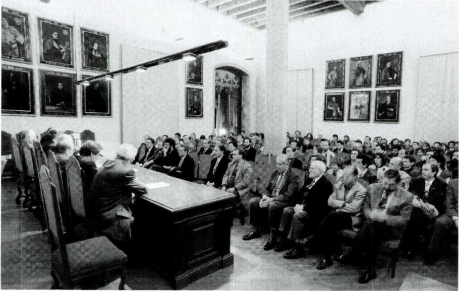
Acte de lliurament del V Premi Catalunya d'Economia a la magnífica Sala de la Columna de l'Ajuntament de Vic.