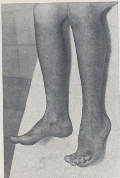
Fig. 4. - A. M. Pie equino y ligeramente en varus, antes de la intervención.