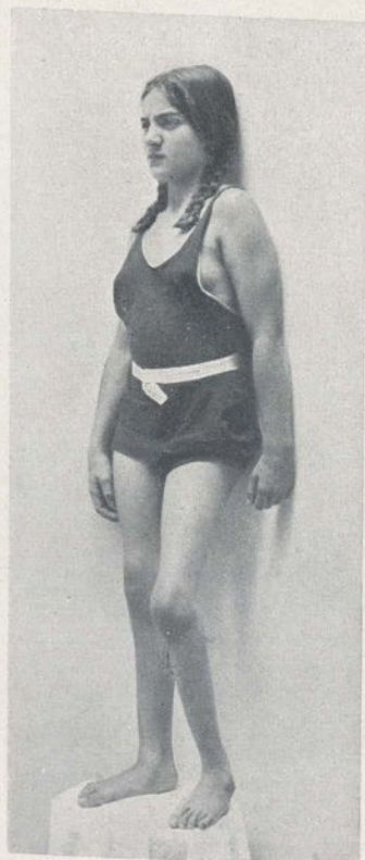
Fig. 1. - M. P. Parálisis infantil de la extremidad inferior izquierda. Imposibilidad de sostenerse sobre la pierna si no se halla apoyada. En esta fotografía se encuentra reclinada contra la pared.