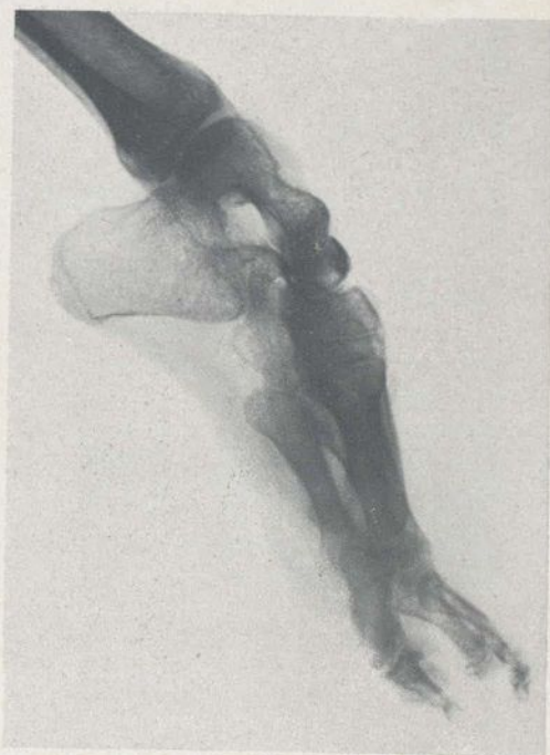
Radiografía n.º 1. - E. B. D.