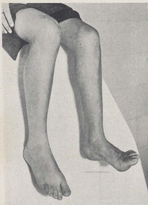
Fig. 5. - A. M. Obsérvese la flexión activa que consigue después de operada.