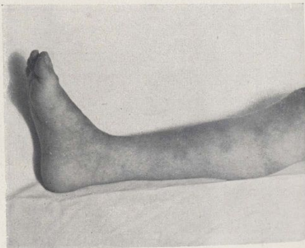
Fig. 8. - R. P. Flexión dorsal que consigue después de operada. El pie equino varus ha desaparecido del todo.