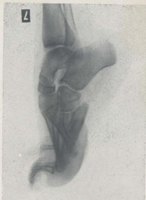
Radiografía n.º 2. - I. G.