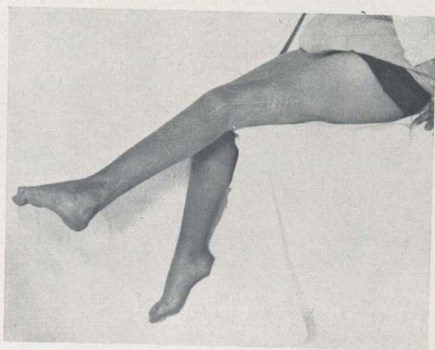
Fig. 2. - M. P. Extensión activa de la pierna después de la trasplatación del bíceps y del tensor de la fascia lata.