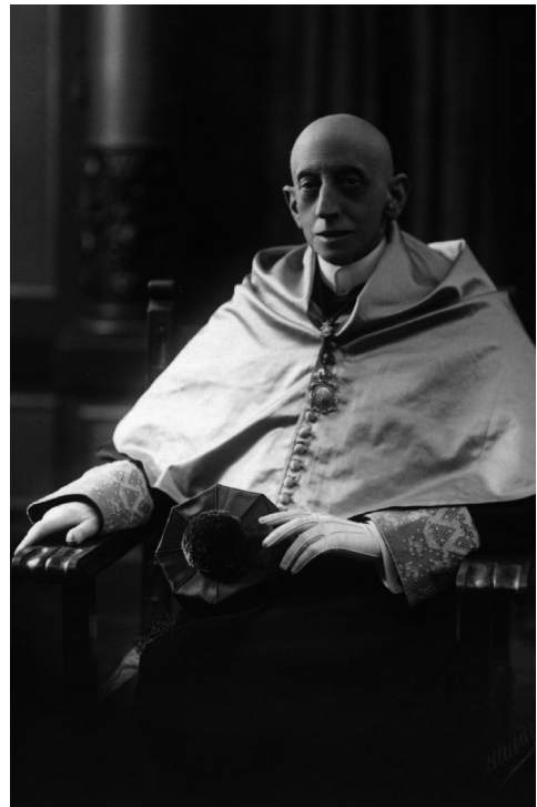
Figura 2. Josep Maria Bartrina i Capella.