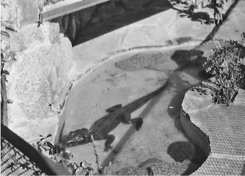
Fig. 2. Fotografia d'un cocodril al jardí de casa d'en Jonch, 1954.

Jonch també va enviar un exemplar del reportatge a Lorenzo. Creia que podia servir-li de currículum en les oposicions a la plaça de conservador del zoo, que esperava que fos convocada de forma imminent.