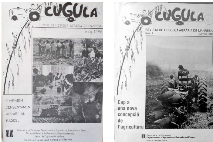
Portades de la revista Cugula , 1986 i 1988.

cions o finançament per tal d'evitar el seu tancament, sinó que el mateix funcionament intern de l'escola generava tensions amb el cap del Servei de Capacitació. Unes tensions reflectides en el fet que el nom que s'utilitzava popularment pels membres del centre fos Escola Agrària de Manresa, mentre que institucionalment era anomenat Centre de Capacitació Agrària de Manresa. Malgrat aquestes desavinences en la manera de funcionar, des del Servei de Capacitació es deixava fer perquè es considerava que l'escola funcionava.