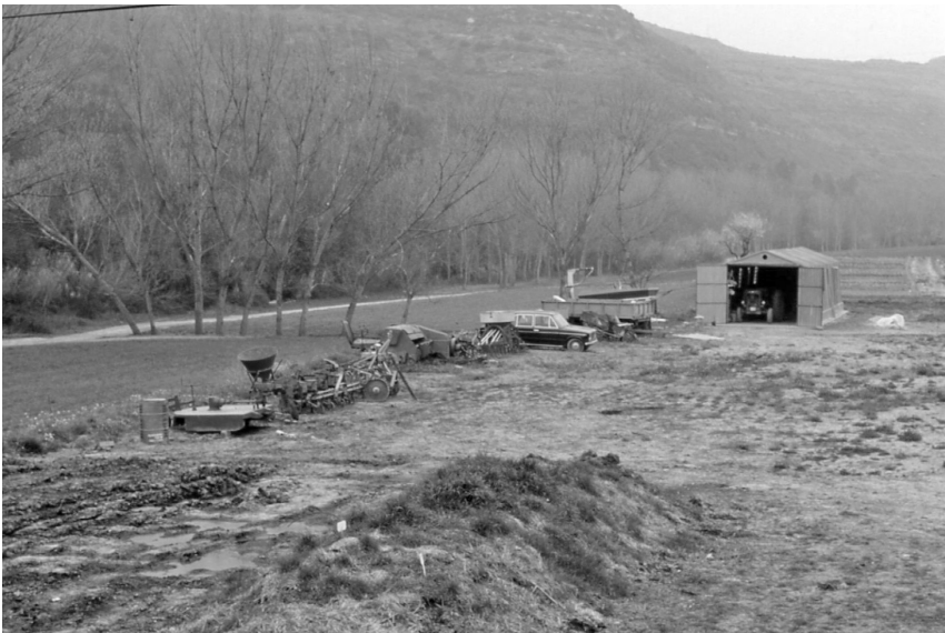
Camps i maquinària a la finca de Can Poc Oli, entre 1986 i 1990.