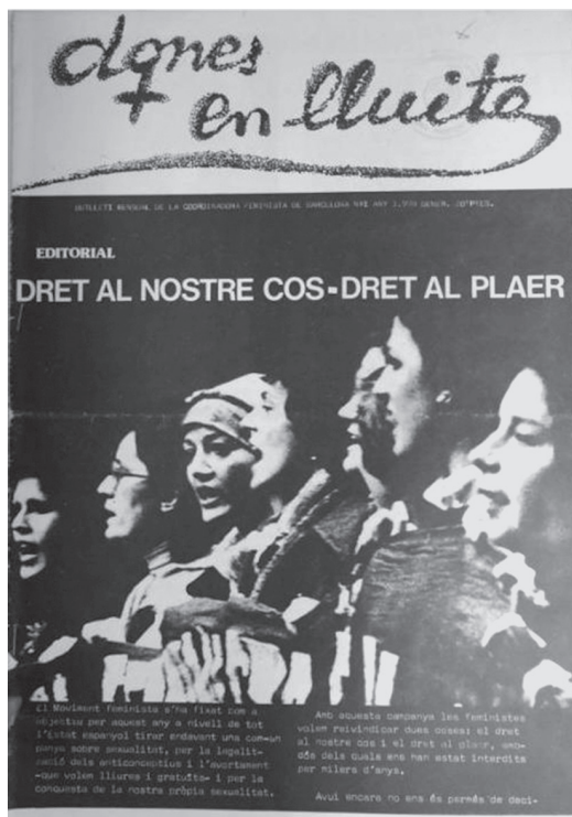
Dones en Lluita , núm. 1 (1978)

de diferents temes, entre elles «Manuales de salud», on es posaven a l'abast de tothom traduccions sobre una nova concepció del cos i la sexualitat com, per exemple, Masturbación. Proceso contra la culpabilidad de las mujeres , de 1981, ¿Por qué sufrir? La regla y sus problemas , de 1983, entre altres (Linàs, 2008: 52-53).