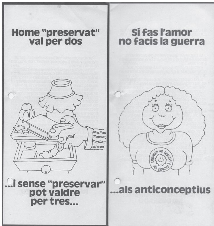
Díptics de la Campanya de Planificació Familiar de l'any 1980.

en l'atenció sanitària per a les dones, sobre control de natalitat i educació sexual. Una de les seves mesures va ser cooperar amb els CPF de forma i dotació diversa.