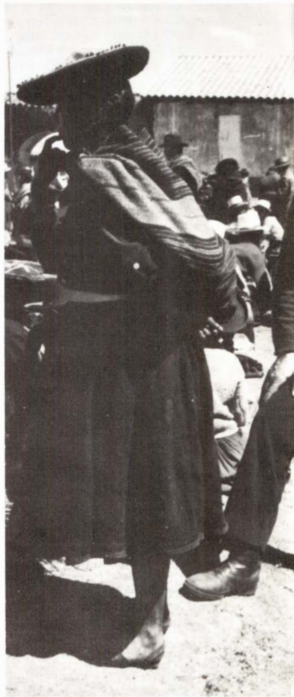
mes. Un grup que es referix a Mèxic, un altre al Perú, lloc en el qual he treballat quatre temporades i un altre grup de problemes que fa referència al nord de Mè-

Un altre aspecte que m'ha interessat moltíssim i sobre el qual tinc molt de material és el de l'etnopsicologia i el problema de la personalitat. En aquest moment estic molt interessat en la psicologia dels pobles i, especialment, l'estructura de personalitat ètnica i de grups, no l'estructura de personalitat de l'individu sinó l'estructura de personalitat de grup, fins i tot el de classe; m'interessa saber quins són els elements comuns que aquestes poblacions poden tenir des del punt de vista de la seva constitució psicològica, de la seva estructura psíquica profunda i, naturalment, això m'ha portat a problemes d'estudis de sistemes de valors, problemes d'orientació, metes de finalitat dintre de la cultura... Per altra banda, a més d'aquests interessos, que he desenvolupat bàsicament aquí a Catalunya quant a l'ètnicitat i a la immigració i el bilingüisme, continua essent Amèrica, m'ha interessat últimament i sobre el qual estic preparant un llibre. Però aquestes problemàtiques, que m'han interessat directament i que estudio aquí a Catalunya, no van separades de les problemàtiques dins les quals m'he format, que són les problemàtiques americanes i que inclouen tres grans grups de proble-