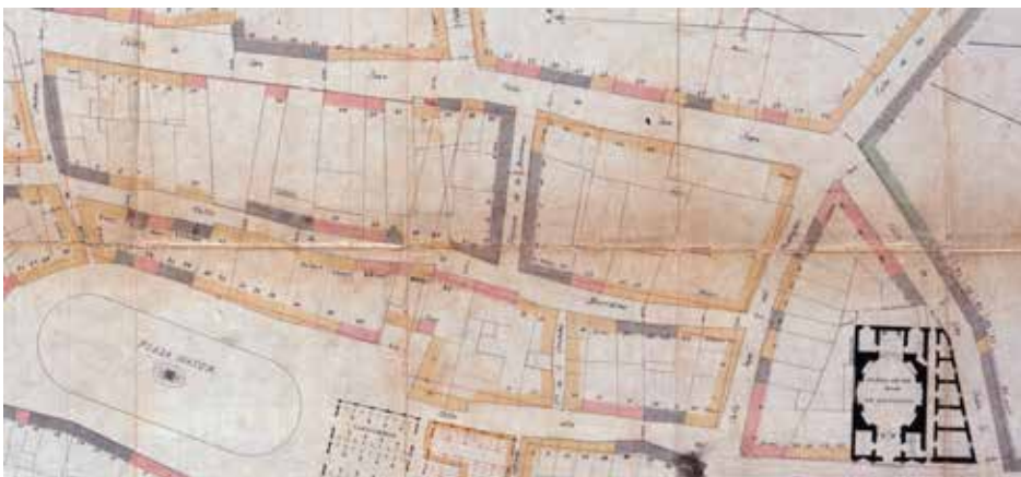
Figura 4. Detall del plànol parcial núm. 1 del Proyecto de Ensanche y Reforma de la Ciudad de Sabadell de Miquel Pascual i Tintorer, 1886, escala 1:300