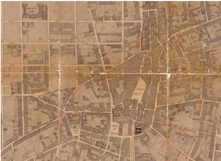
Figura 3. Detall del «Plano General», full núm. 2, del Proyecto de Ensanche y Reforma de la Ciudad de Sabadell de Miquel Pascual, 1886, escala 1:2.000

«Cruce de dos calles de 10 metros»; el quart, que està a escala 1:500, s'anomena «Distribución de las Manzanas en solares»; i el cinquè, a escala 1:1.000, duu per títol «Distribución de las cloacas en la zona de Ensanche».