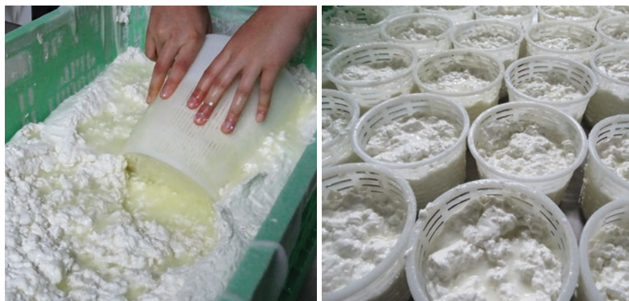
FIGURA 2. Elaboració de formatge a Can Pauet. Quallada escorrent-se

h) Els recipients plens es posen en refrigeració a 2-4 °C durant un dia per a obtenir una textura sòlida i fresca.