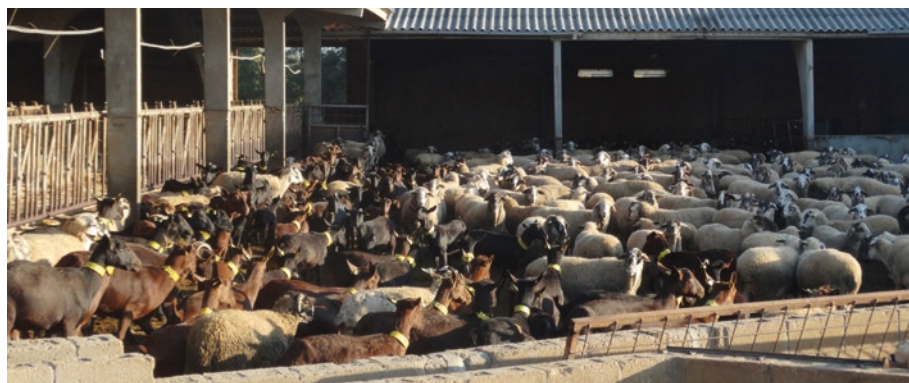
FIGURA 1. Ovelles i cabres de Can Pauet (Jafre, Baix Empordà) a l'estable