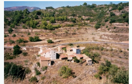
Mas de Rodrigo (Llucena, Alacantí), en la pujada del port del Rebolcador. La carretera que ascendeix de Figueroles cap al Castell de Vilamalefa ens ofereix una panoràmica de l'abandonament en què majorment ha quedat la vida masovera a la zona sud del pic del Penyagolosa.