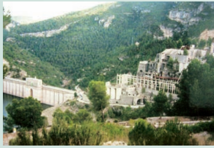
Embassament de Benaixeve (Serrans). Al costat de la fàbrica i l'embassament hi ha l'antic poblat de construcció de l'embassament, ja en ruïnes. L'antic lloc de Benaixeve està inundat des de fa més de mig segle i la seua població s'ha repartit en diversos nuclis al llarg de tres comarques distintes.