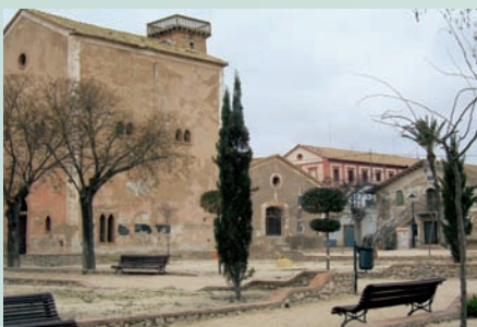
La colònia de Santa Eulàlia (Sax i Villena, Alt Vinalopó) conté desenes de cases que pertangueren als antics colons. Tot i que actualment no té població registrada, hi ha residents en determinades èpoques de l'any. El conjunt és d'una bellesa extraordinària, i s'ha obert un restaurant. Es pot veure l'església i les antigues fàbriques. A l'esquerra, plaça de l'antiga colònia agrària de Santa Eulàlia. A la dreta, Teatre Cervantes. Santa Eulàlia funcionava com un autèntic municipi, i entre els seus serveis destaca el teatre, que tant en el seu interior com en l'exterior és especialment destacat. El seu estat de conservació és relativament bo.