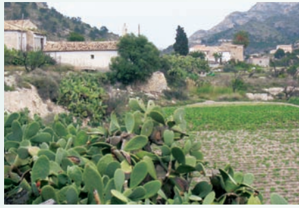
Monnegre de dalt (Xixona, Alacantí). Aquest lloc va ser abandonat fa dècades. No correspon a un nucli de població concentrat, sinó més aviat a una sèrie de vivendes que apareixen més o menys alineades al marge esquerre del riu Monnegre, aigües avall de la presa de Tibi, quan la vall s'eixampla prou. Vora el Monnegre hi ha fèrtils terrasses on es conreen hortalises, i que contrasten amb la sequedat del paisatge. Algunes cases han estat recuperades recentment, tot i que al lloc no hi ha població censada. L'antiga escola, amb la casa del mestre adjunta, encara conserva restes com ara taules.