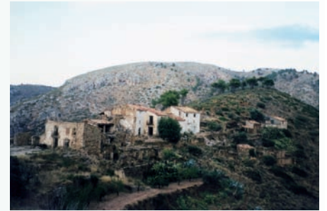
Mas de la Costa (Llucena, Alacantí), abandonat. Després de l'ascensió des de la Vall del riu Lluçena, s'arriba a aquest mas, camí del Penyagolosa. El mas conserva una antiga escola que ja fa anys que es va tancar com a conseqüència de l'emigració de la població a Llucena i a les fàbriques de la Plana.