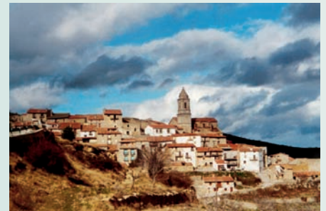
El Boixar (Baix Maestrat). Aquesta pedania de la Pobra de Benifassà té població censada, però durant els durs mesos de l'hivern el poble queda buit. És una situació molt semblant a la viscuda en molts indrets més de les comarques valencianes.