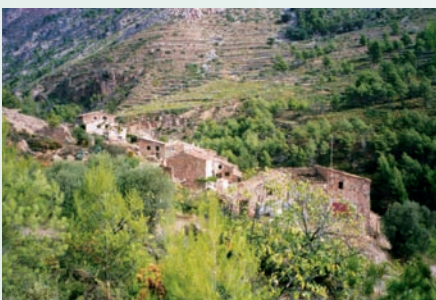
Masos a la vall del riu Lluçena. Des de Llucena arranca una carretera en direcció nord que recorre la vall del riu Lluçena. Als marges hi ha diversos grups de masos, així com els accessos a uns altres. És una de les zones on encara es pot veure una mínima ocupació masovera del territori.