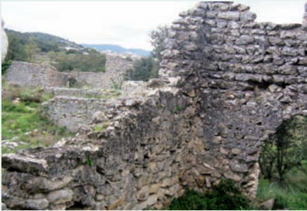
Despoblat morisc de l'Atzúvieta (la Vall d'Alcalà, Marina Alta). A la Marina Alta i el Comtat, hi ha nombroses restes de l'antiga ocupació àrab de les terres valencianes. El despoblat millor conservat en l'actualitat és l'Atzúvieta. La Marina es va repoblar posteriorment amb colons provinents de les Illes Balears.