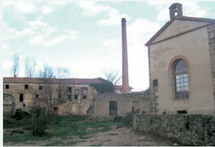
Colònia Giner (Morella, Ports). Erigida com a fàbrica tèxtil a finals del segle XIX, actualment és restaurada per una fundació com a alberg i zona d'oci. Va ser construïda seguint el model d'industrialització anglesa, que és el mateix que s'aplicà a la zona de l'Hospitalet de Llobregat (Barcelonès).