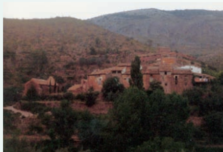
Arteas de Abajo és un veïnat de Begís (Alt Palància). Uns quilòmetres amunt es troba Arteas de Arriba, que està deshabitada. Fins a Arteas de Abajo encara arriba el camí asfaltat provinent de Begís. Per accedir a Arteas de Arriba l'asfalt desapareix. Actualment aquesta zona està cremada.