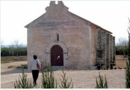
L'ermita de Tèrnils (Carcaixent, Ribera Alta) estava situada a l'antic lloc de Tèrnils. Aquest assentament va ser abandonat fa segles, i igual com moltes ermites més, és l'últim testimoni d'aquell poblament. En igual cas trobem el Carrascal (la Jana) o l'ermita del Molar (Elx).