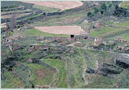
La Hortichuela (Alfont). Els Serrans són una comarca especialment castigada pel despoblament com a conseqüència de l'emigració i la construcció d'embassaments. La Hortichuela està situada vora el nucli principal de població d'Alfont, i actualment es troba en ruïnes.