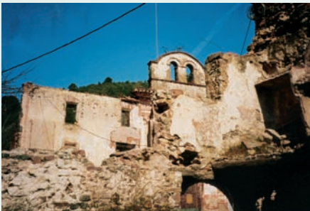
Església i alguns corrals a Benitandús (la serra d'Espadà). Aquest llogaret pertany a Alcúdia de Veo, i està situat a la cua de l'embassament d'Onda. D'uns anys ençà ha recuperat una part de la seua població, perquè es troba prop d'una via de comunicació relativament important.