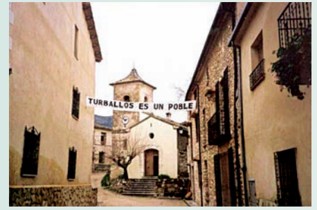
Turballos (Muro d'Alcoi, Comtat). Aquesta pedania de Muro es va despoblar, i va ser "rehabilitada" per una colònia de cristians franciscans. Actualment hi ha una disputa entre els residents de la colònia i els antics propietaris. La vida de la comunitat segueix el model de Sant Francesc d'Assís.