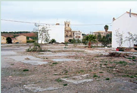
Gavarda vella (Ribera Alta). La pantanada de l'any 1982 va negar Gavarda. Posteriorment, i com a mesura de seguretat, s'oferiren condicions perquè els veïns marxaren. Les cases dels qui emigraren foren enderrocades. Però hi va haver gent que no se'n volgué anar. Avui les seues cases estan rodejades de solars on es veuen els antics paviments. A la dreta, casa de Gavarda la vella rodejada de solars. Les aigües van arribar a nivells altíssims durant la inundació. Una placa situada a la paret de l'església encara ho recorda a veïns i visitants.