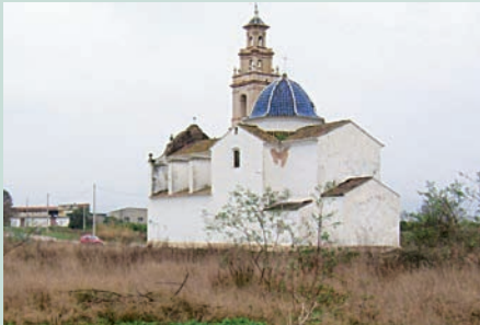
A l'esquerra, església de Beneixida (Ribera Alta). Arran de la pantanada de Tous, Beneixida va ser inundat. El municipi s'ha traslladat al sud, en uns terrenys més elevats. De l'antic poble queden en peu l'església, la font de l'entrada del poble i el cementeri, a més d'un carrer asfaltat que fa un recorregut per aquests llocs i acaba darrere l'església. Al mig, vista de la font i l'església de Beneixida. A la dreta, la placa de l'antic carrer de José Antonio, a Beneixida, situada sobre la paret de l'església, no duu enlloc. En els solars veïns es veuen encara restes d'asfalt, alguna vorera, i també algun menut tros del paviment de les antigues vivendes que va haver-hi.