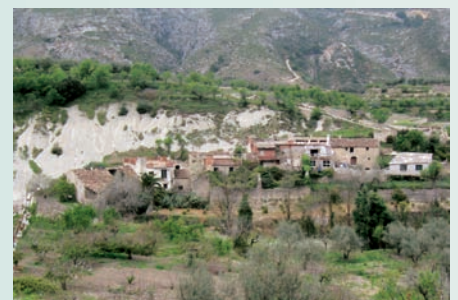
Llobai (la Vall de Gallinera, Marina Alta) és un lloc deshabitat (que no abandonat). Les solides del terreny cauen directament al carrer que rodeja les vivendes del nucli de població. El botànic Cavanilles ja cita "Llobáy de Gallinera" en les seues Observaciones.