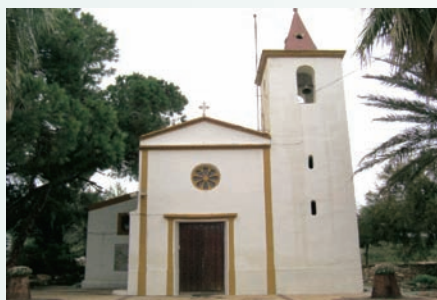
Ermita de l'antic municipi de Rebate (Pilar de la Foradada, Baix Segura). El poble va ser enderrocat totalment, i un restaurant ocupa una gran part de les antigues vivendes. També hi ha, annexos a l'ermita, alguns antics habitatges que han estat reformats. A la dreta, cementiri de Rebate, obert i amb unes poques tombes. Actualment l'Ajuntament de Pilar de la Foradada prepara una publicació sobre l'antic lloc de Rebate, situat a la serra d'Escalona, prop de la frontera amb la Comunitat de Múrcia, i aproximadament a mig camí entre els nuclis d'Oriola i Pilar de la Foradada.