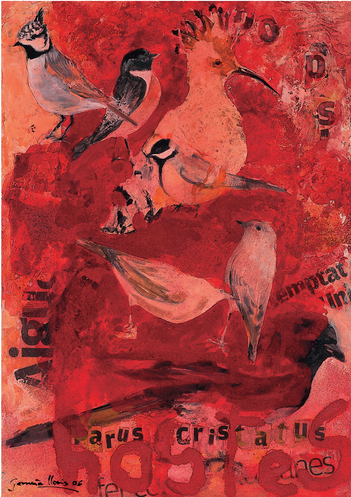
IL·LUSTRACIÓ: GERMÀ LLORIS. Tècnica mixta. 2006. 28,4x40 cm.