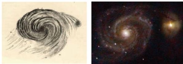
A l'esquerra, dibuix de la galàxia M51 realitzat per Lord Rosse el 1845.

Són molts els aficionats a l'astronomia que visualitzen a diari la imatge astronòmica del dia en Internet ( http://www.ishango.org/apod/apod.htm ) o es connecten a les pàgines de notícies –sempre acompanyades d'espectaculars imatges– de diferents observatoris arreu del món.