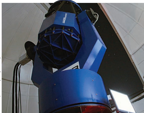
El telescopi TROBAR, a l'estació d'observació d'Aras de los Olmos.

A la dreta, fotografia de M51 realitzada amb el telescopi TROBAR (Aras de los Olmos) i una càmera CCD Apogee per l'autor i altres astrònoms del grup Landerer d'Astrofotografia de l'Observatori Astronòmic de la Universitat de València, la nit del 16 de juny de 2005. S'hi han combinat 6 exposicions de 3 minuts sense filtre i 3 exposicions de 5 minuts en cadascun dels filtres B (blau), R (roig) i V (verd) del sistema Johnson-Cousins. El processament l'ha fet Vicent Peris utilitzant PixInsight ( http://pleiades-astrophoto.com/pixinsight/ ).