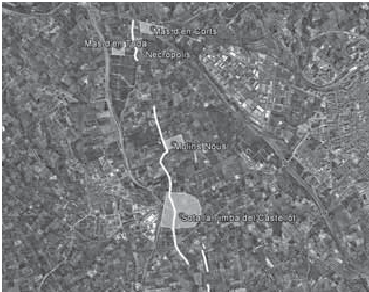
Fig. 3. Traces de sèquia prospectades i àrees dels jaciments romans: terrisseria del Mas d'en Corta, vil·la del Mas d'en Toda, vil·la de Molins Nous, terrisseria i aglomeració de Sota la Timba del Castellot.

pol·líniques. És cert que en el període medieval sorgeix un factor d'evolució nou, que són les parròquies. Al seu voltant s'agrupa part de la població rural. Ara bé, a la llum dels estudis del poblament del PAT, cal pensar que en el període romà també hi havia alguns nuclis o aglomeracions, de moment però, mal coneguts.